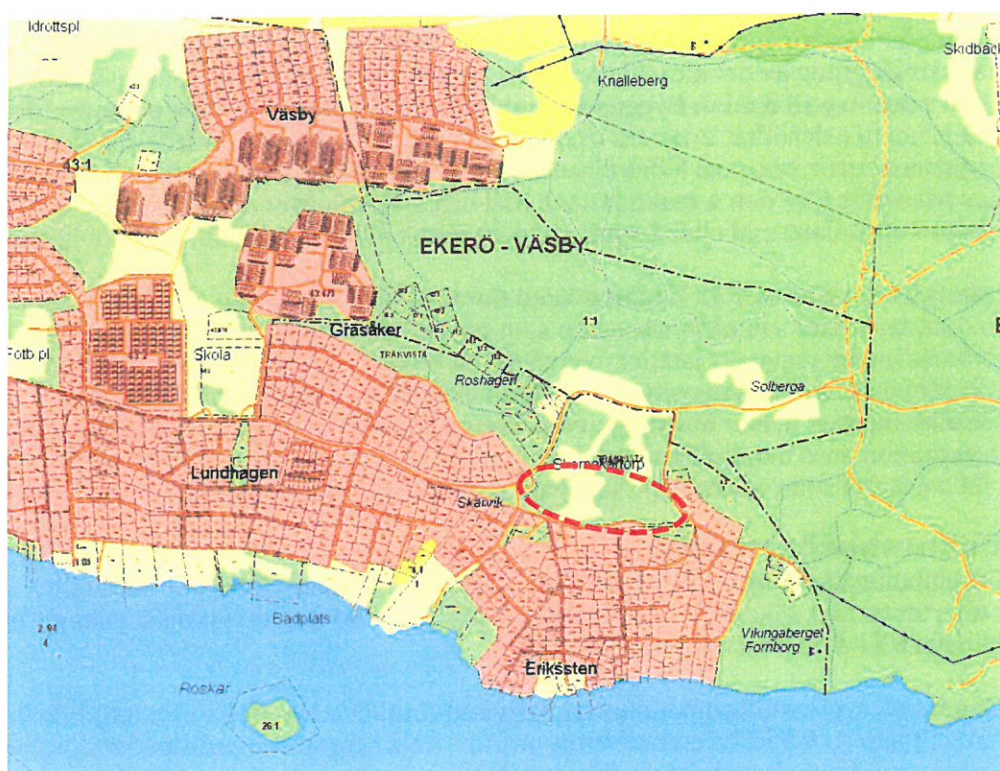
Karta med planområdet inritat