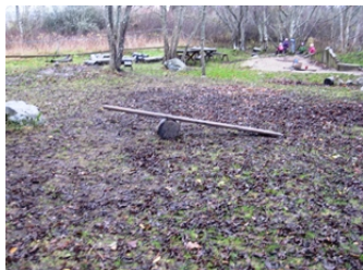
Gungbrädan på gården

På gården har barnen tillsammans gjort en gungbräda av en stubbe och en bräda. En pedagog berättar att barnen har provat hur jämvikten fungerar genom att placera sig på olika sätt på brädan. I en annan del av gården har en grupp barn byggt en buss av lastpallar.