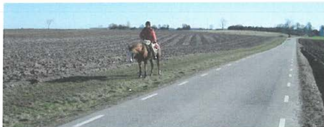
En ridväg vid Tottarp i Staffanstorps kommun.

Studierna har gjorts i södra Sverige där den allemansrättsliga marken är stark begränsad på grund av att det mesta av åkermarken är odlad. Dessutom är befolkningsstrycket i dessa områden stort.