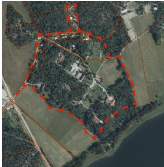
Kartan visar planområdets preliminära avgränsning