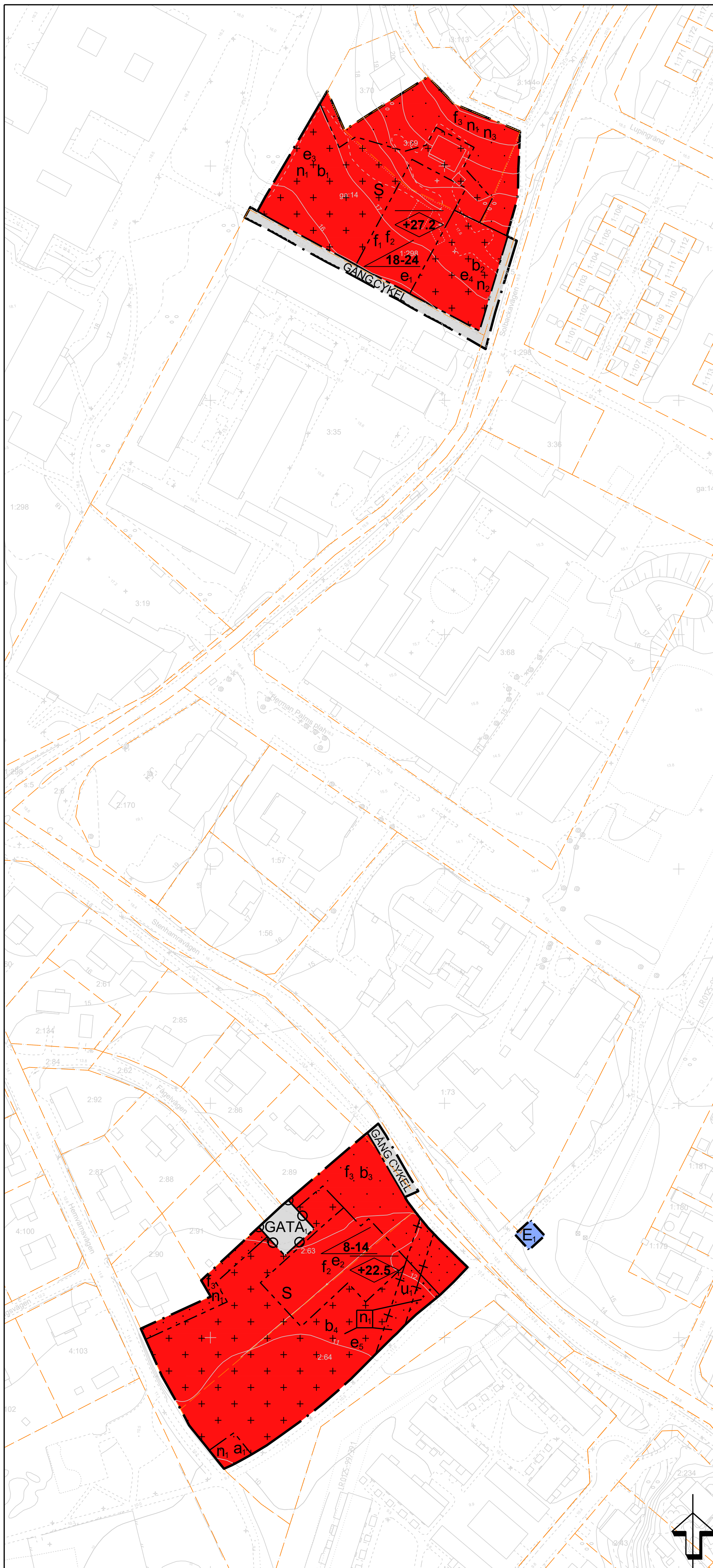
PLANKARTA SKALA 1:1000 (A1) 1:2000 (A3)