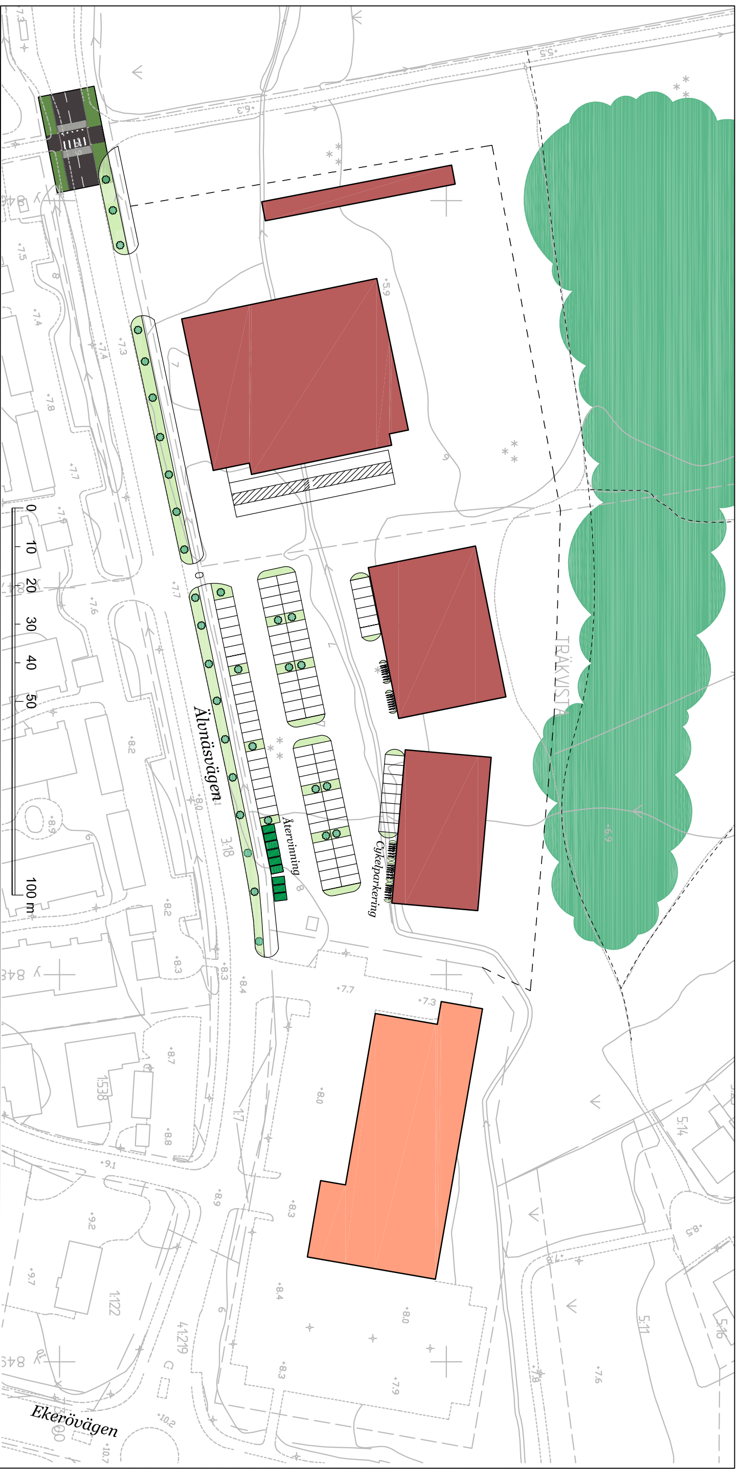
ILLUSTRATION SKALA 1:1000 (A3)