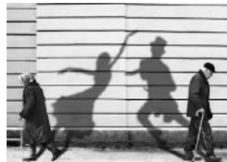
Projekt levande historia