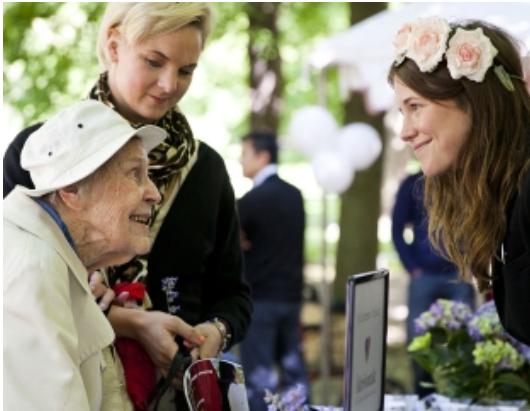
Alla Äldres Dag