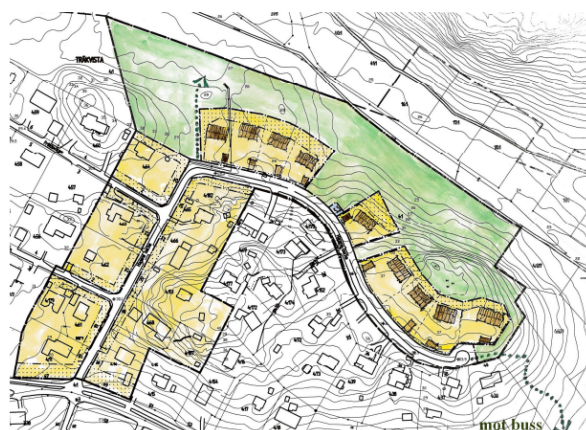
Planillustration med föreslagen placering av husen