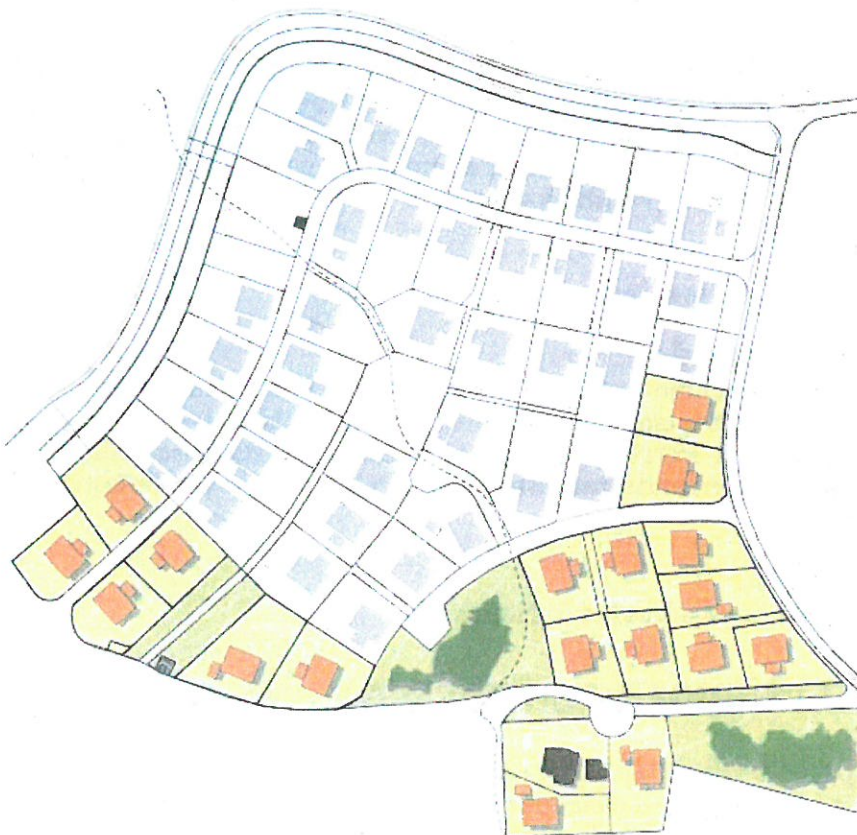
Illustration av nytillkommande bebyggelse inom området samt befintlig tomt.

Då ytbehovet är minskat för de enskilda fastigheterna samt att en förflyttning av Jungfrusundsvägen inte kommer att ske, kommer detaljplanen rymma fler tomter än den gällande planen (007). Minsta tomtstorlek på de nya tomterna har satts till 1000 m 2 för att ta hänsyn till den befintliga bebyggelsen i området. De omkringliggande detaljplanerna har ofta tomtstorlekar kring denna storlek. Detta är även den generella riktlinjen för tomtplatser som anges i Ekerö kommuns översiktsplan.