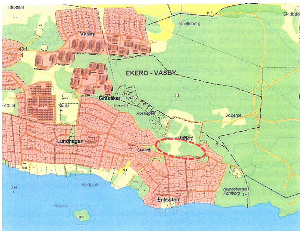
Karta med planområdet inritat