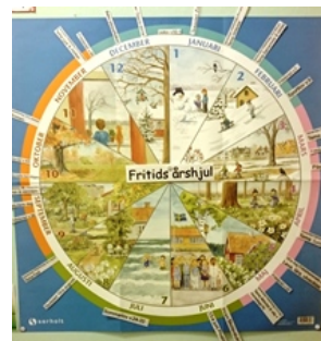
Årshjulet som finns på varje avdelning

Alla Ekerö skolors fritidshemsansvariga träffas en gång i månaden. För närvarande utformar de underlag för pedagogiska planeringar (PP) med speciell inriktning på fritidshemmen. Dessa PP utvecklar därefter biträdande rektor tillsammans med modulansvariga på fritidshemmen. Fritidshemmen har ett gemensamt årshjul för sitt arbete men det ges utrymme för varje fritidshem att detaljplanera de olika aktiviteterna på respektive modul. Vi ser årshjulet uppsatt på varje avdelning. Pedagogerna bestämmer hur huvudaktiviteter ska utformas, såsom skogs dagar, skrivarestuga, kreativt skapande och experiment som är kopplade till skolans arbetsområden.