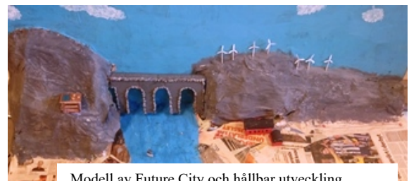
Modell av Future City och hållbar utveckling

Vid elevens val-lektioner där klasser arbetar med Future City får eleverna välja om de vill bygga staden med hjälp av MineCraft eller genom att bygga modeller själva. Elever visar hur de har tänkt med sina städer och hur det även ges