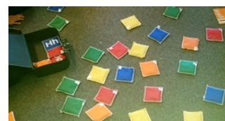
Trulles Latjolajbanlåda med ljudpåsar

På en lektion sitter eleverna i en ring och läraren säger att idag ska vi lära oss två saker. Eleverna får först öva på Trullesången och därefter övar de bokstavsljuden. I Latjolajbanlådan ligger “Ljudpåsar” som har en bokstav på undersidan och som läggs ut på golvet. Eleverna får i tur och ordning vända på påsarna. Alla eleverna ljudar den uppvända bokstaven och den som vänt påsen får säga ett ord där ljudet ingår. Några elever ber en annan elev om hjälp.