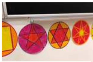
Stjärnor som används vid inläring av siffror.

Morgonperioden följer en tydlig struktur. Efter hälsningsrutinerna börjar morgonen ofta med att klassen sjunger eller spelar. Vi ser vid ett tillfälle i åk 3 att alla elever spelar flöjt. Läraren skriver upp dagens schema på tavlan. I de lägre årskurserna ser vi att läraren har högläsning, eleverna äter en frukt, dricker vatten och har en kort rast innan arbetet med periodens specifika ämne börjar. Elever i åk 1 - åk 8 har en arbetsbok till varje temaarbete. I denna arbetar eleverna med stor noggrannhet och stort fokus. Utifrån lärarnas underlag klistrar eleverna in sina färdiga arbeten i sin arbetsbok tillsammans med texter som de skriver. I alla klasser går läraren först igenom vad eleverna ska göra i sina arbetsböcker. Exempelvis visar