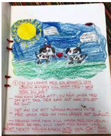
Elevernas gemensamma bok

eleverna erbjuds att utforska olika naturmaterial såsom lera, bivax och ull, vilket vi ser resultat av på avdelningarna.