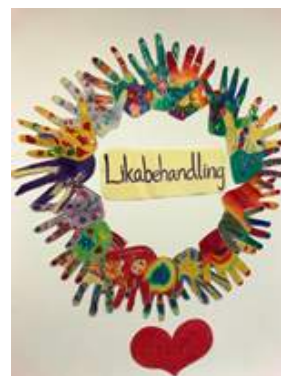
Grupparbete - Värdegrunden

Drottningholmskolan har en plan mot diskriminering och kränkande behandling “Drottningholmskolans likabehandlingsplan”. Lärarna berättar för oss att varje läsår inleds med att klassläraren tillsammans med elevrådet informerar om likabehandlingsplanen och bland annat går igenom skolans trivselregler, som finns uppsatta på klassrumsväggar. I några klassrum ser vi på väggarna ett grupparbete som handlar om olikheter. Lärarna säger också att det största arbetet görs genom att de kontinuerligt pratar med eleverna om kamratanda och värdegrund. Vi läser att eleverna vid läsårets slut gör en trivselenkät, som utvärderas av lärarna.