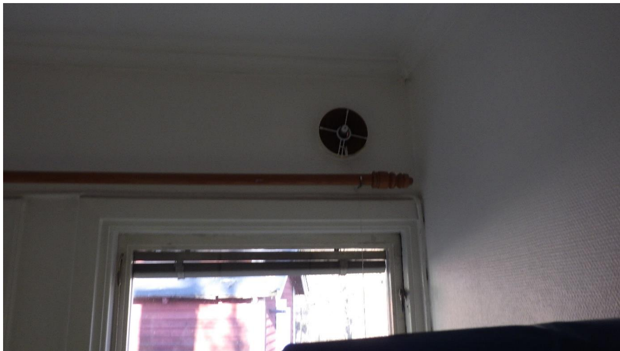
Rum 114 - Frånluft självdrag.