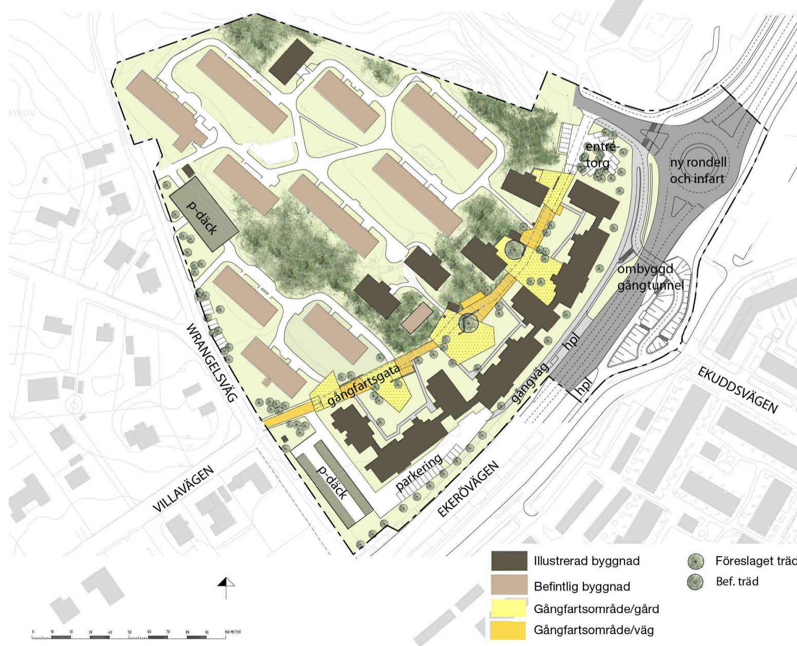
ILLUSTRATIONSPLAN SKALA 1:2000 (A1)