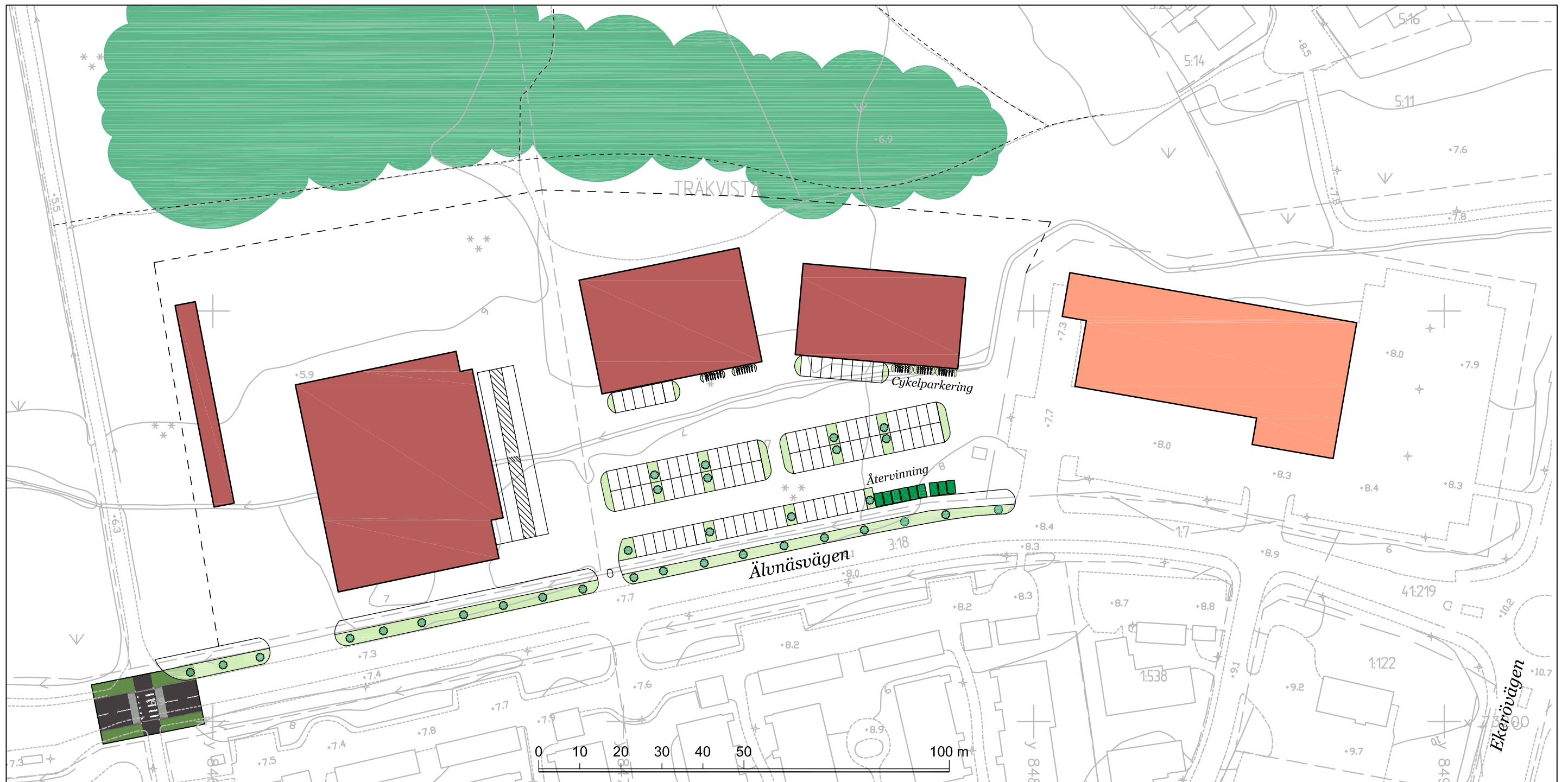
ILLUSTRATION SKALA 1:1000 (A3)