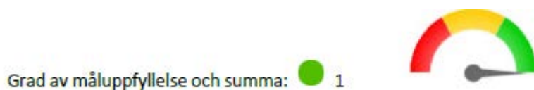
Tabell 1. Ekerö kommuns finansiella mål 2021

I årsredovisningen görs en avstämning mot kommunens finansiella mål för god ekonomisk hushållning som fastställts i budget för 2021. I årsredovisningen framgår att det finansiella målet är uppnått för år 2021. Målet baseras på hur väl två underliggande mål är uppnådda utifrån bedömning enligt kriterierna enligt indikatorn.