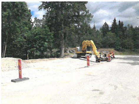
Bild 1: Breddning av infarten till Skå återvinningscentral, juni 2014.

Infarten till Skå återvinningscentral breddades under sommaren för att öka säkerheten vid köbildning in till återvinningscentralen. Anläggningen försågs under hösten med ett tak för el-avfall och tydliga ordningsregler. Antalet besök ökade med 5 000 från 2013 till totalt 60 000 besök 2014. Detta, samt att företagare kan använda återvinningscentralen mot en kostnad per besök, har bidragit att avfallsmängderna ökat.