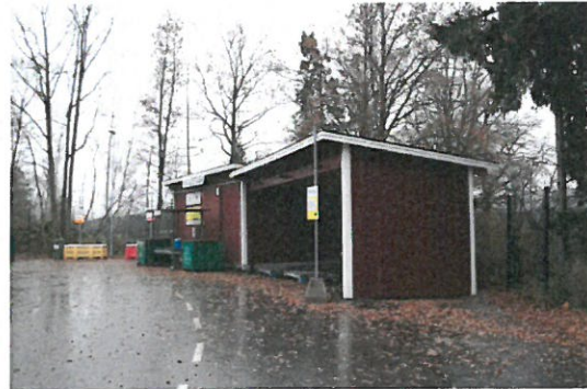
Bild 2: Nytt tak för el-avfall bredvid befintlig miljöbod på Skå återvinningscentral, november 2014.