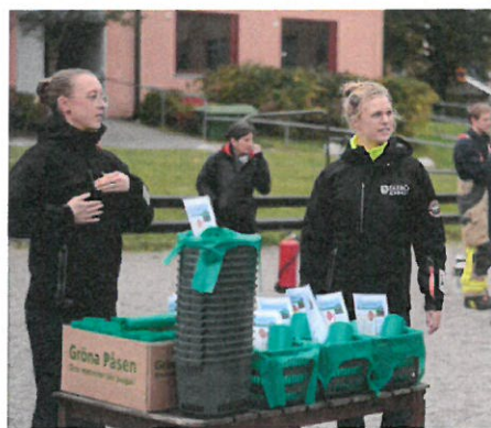
Bild 2: Utdelning av startpaket för matavfallsinsamling till ett flerbostadsområde, oktober 2014.