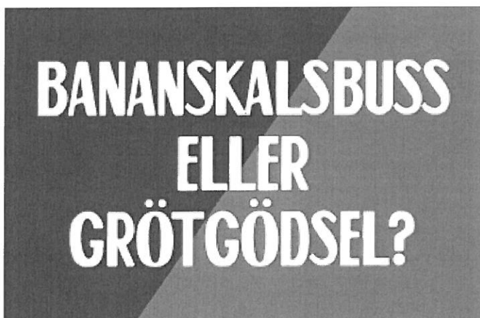
Bild: Axplock från kampanj: Sortera matresten ( www.sorteramatresten.se )

Stockholms läns kommuner började en gemensam informationskampanj, Sortera matresten, för att engagera alla som bor i regionen att sortera ut sina matrester. Kampanjen pågår under fem år. Ekerö kommun sitter med i styrgruppen genom en av avfallsingenjörerna.