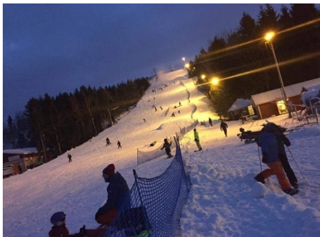
5 Jan 2016