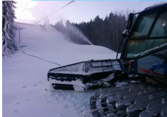
23 Nov 2015