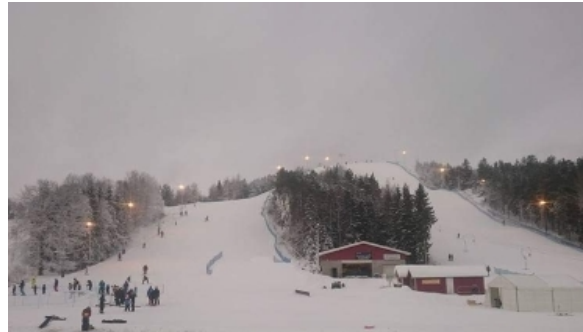
11 Jan 2016