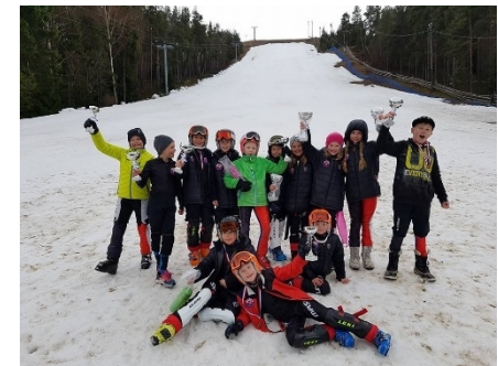
25 April 2016 - KM