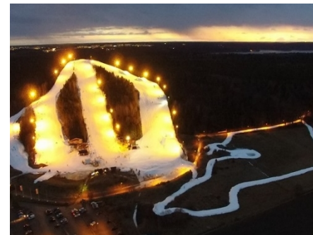
18 Mars 2016