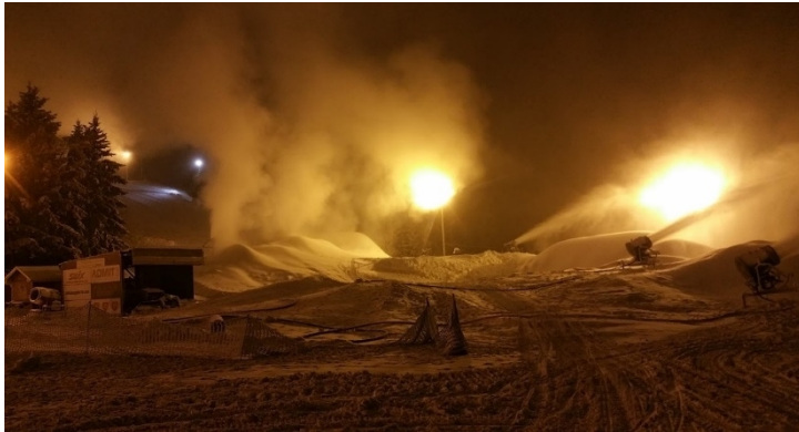
20 nov 2015