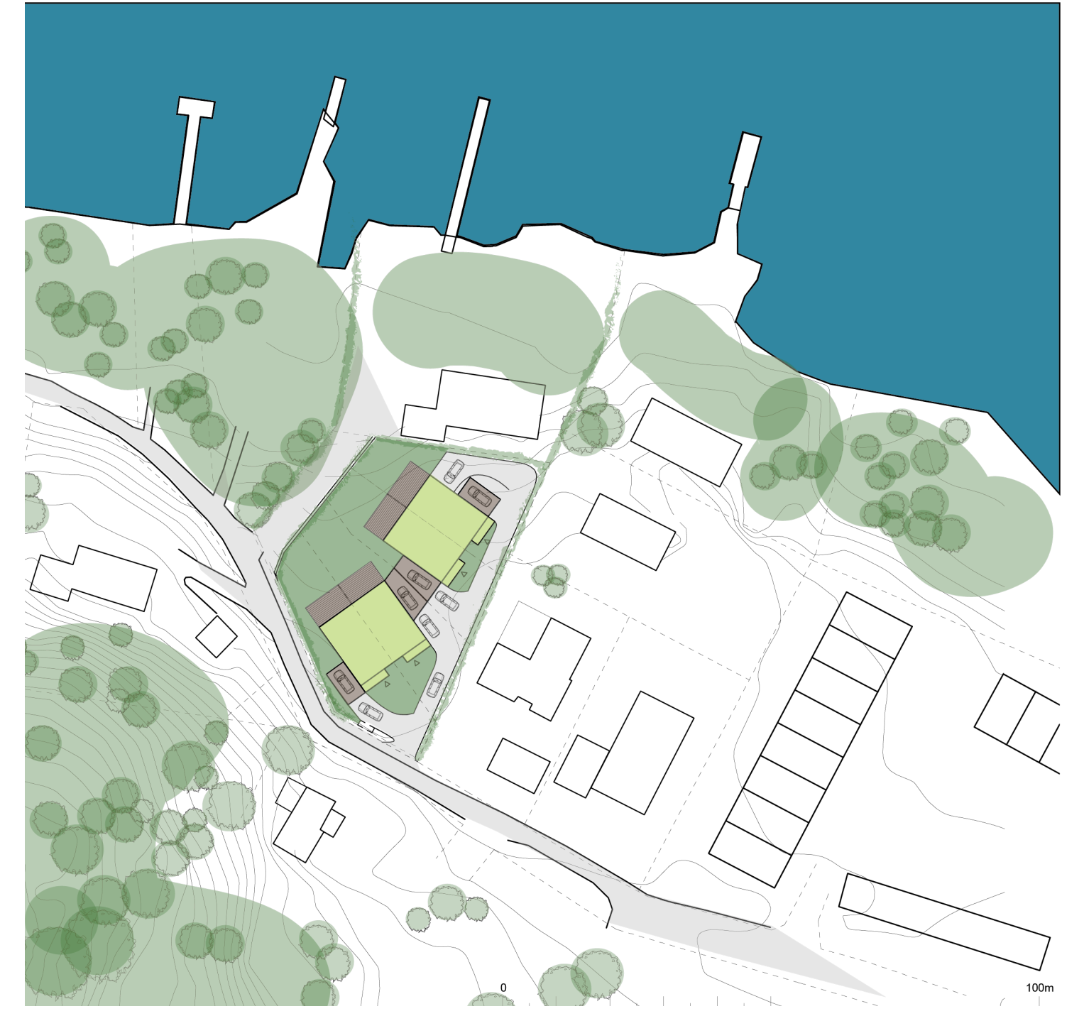
SITUATIONSPLAN SKALA 1:1000 (A1)