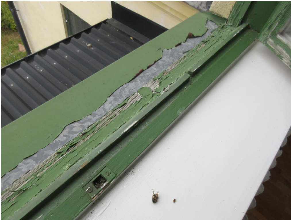
Fönster med eftersatt underhåll