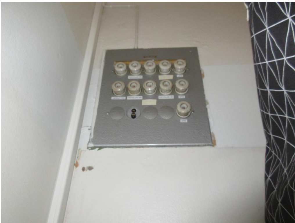
Gamla elektriska installationer