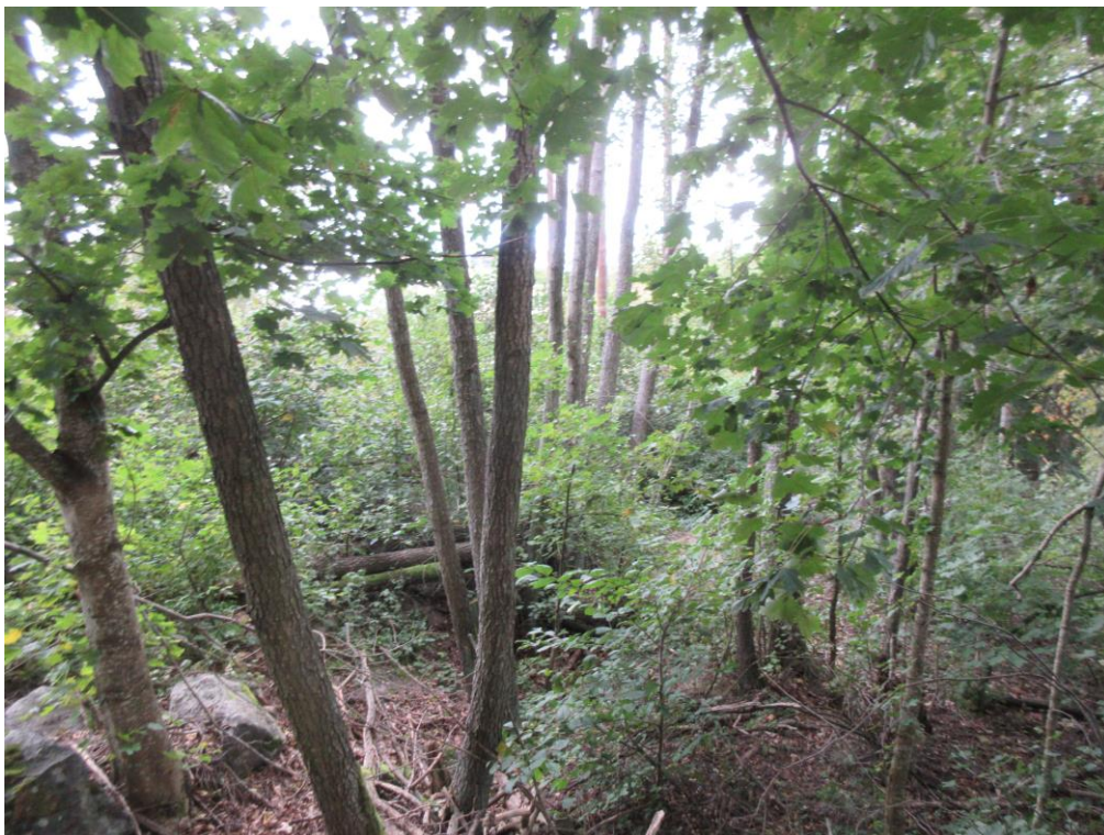
Tomtens vegetation gör det svårt att undersöka hela tomten.