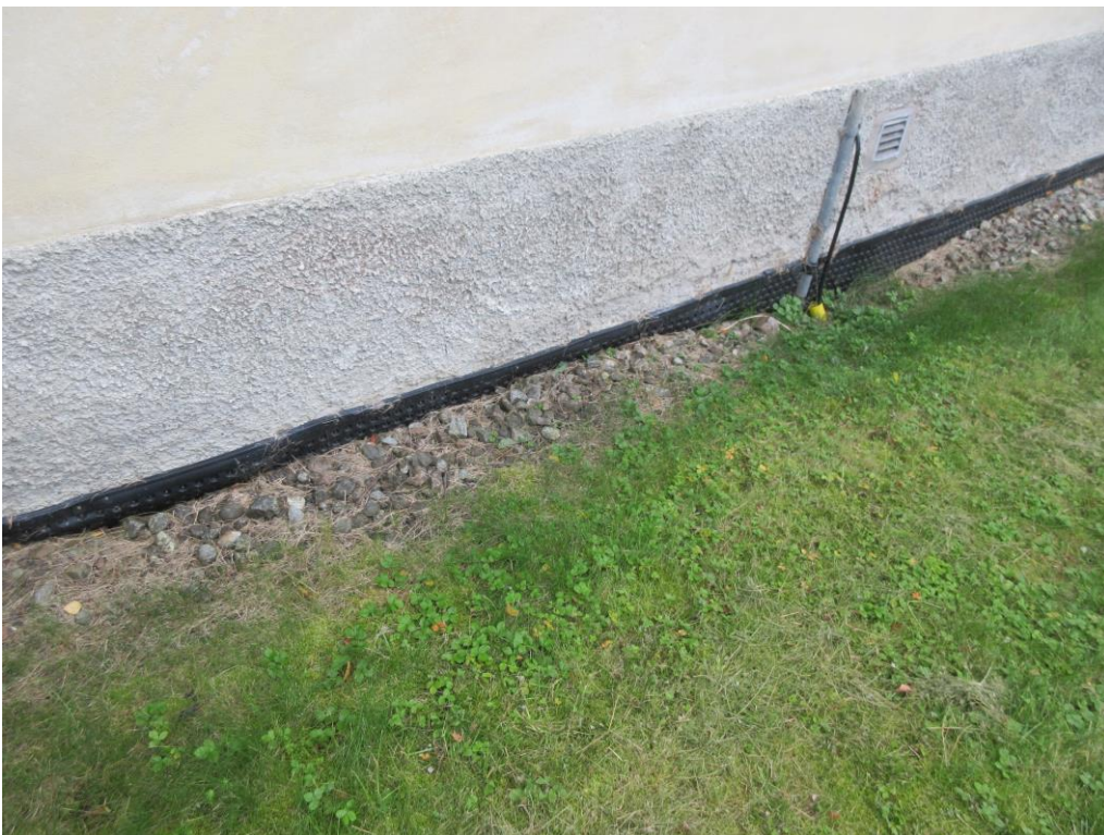
Del av grunden kompletterad med "Platonmatta"