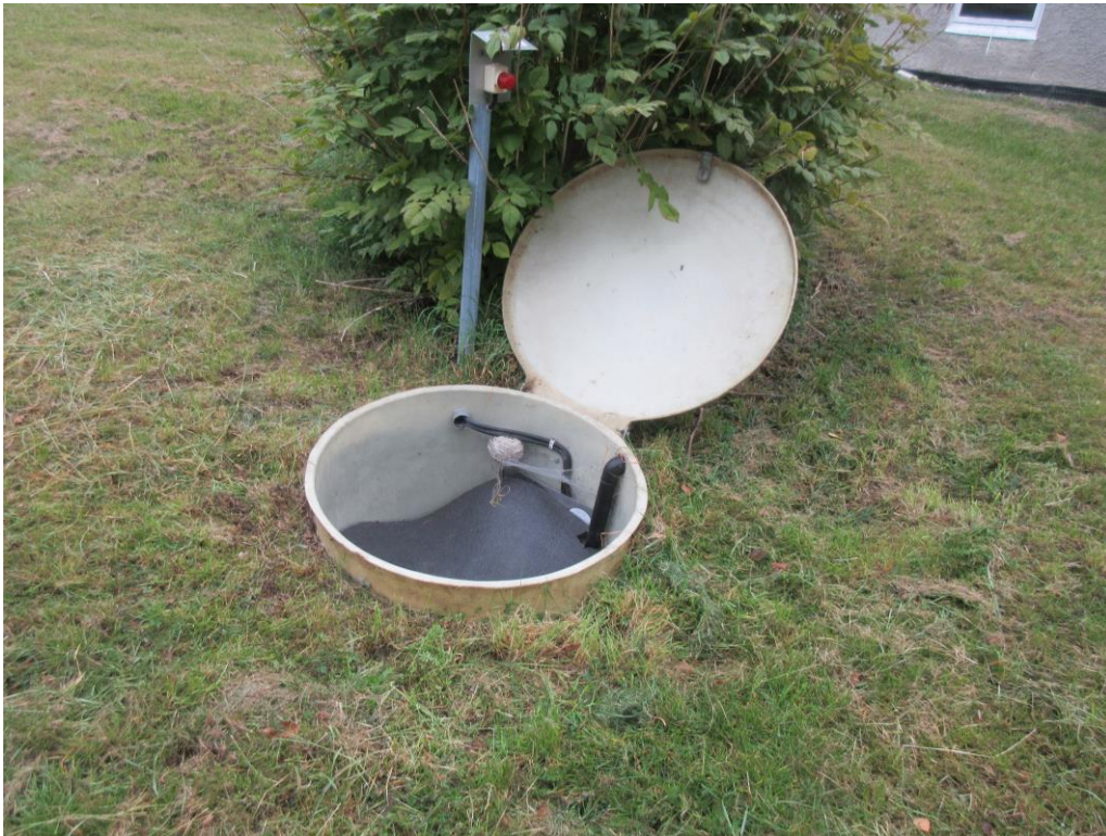
Avloppspumpen, placerad på fastigheten.