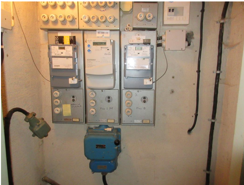
Äldre elektriska installationer.