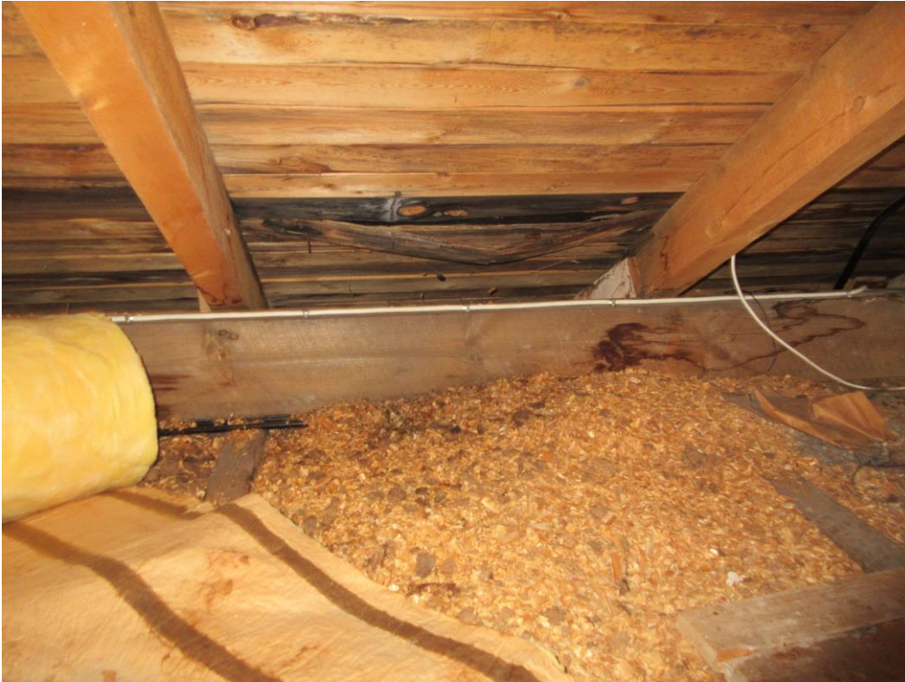
Rötskadad yttertakspanel, sett från vindsutrymmet