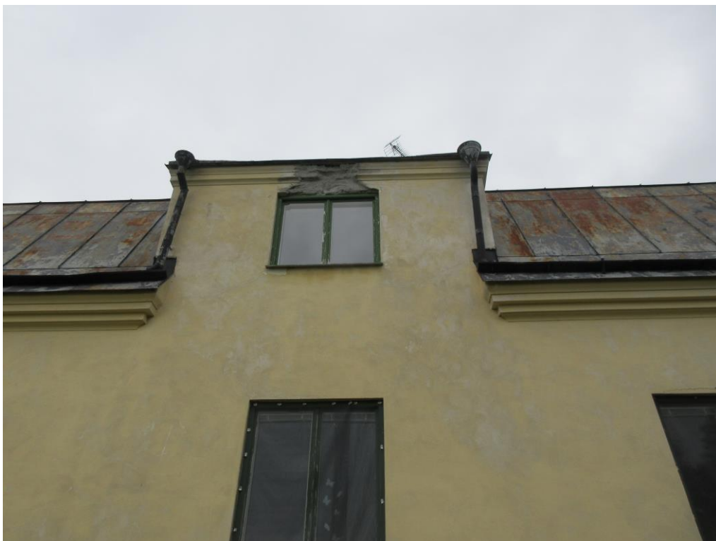
Dåligt lagad putsskada