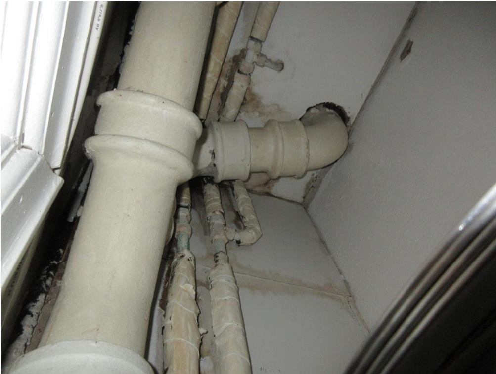
Läckage från duschrummet på övre våningsplanet.