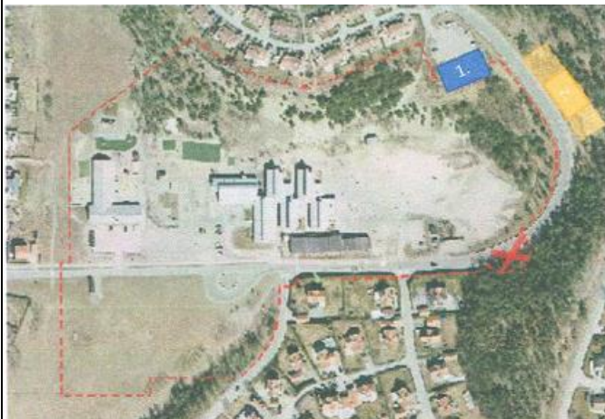
Fig 1 Förslag till alternativ placering1, markerat med blått. Alternativ placering 2, markerat med gult.

Om det av någon anledning är förbehållet att återvinningsstationen måste placeras på motsatt sida i förhållande till skolan, är ett annat förslag att maximera avståndet till privata bostäder, markerat i gult och betecknat 2. i Fig. 1.