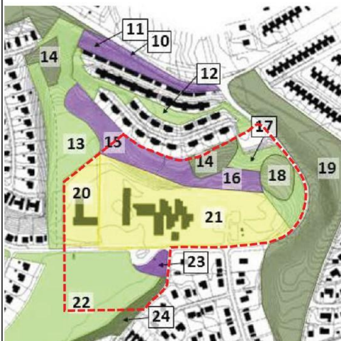
Figur 5, Del av skötselplanen som omfattar området kring Sanduddens skola. Lila färg markerar områden med speciellt höga naturvärden. Mörkgrön färg visar trädklädda naturområden och ljusgrön färg visar öppna områden. Skolgården är markerad i gult. Röd markering visar det aktuella planområdet.

Vi skulle också vilja ta del av hur anläggning av en Avlämnings/ upphämningsplats för elever från Munsöhållet norr om planområdet skulle göras, sid 27 i planbeskrivningen. Det saknas i den trafikutredning som gjorts. Om tanken är att det ska finnas vid Ekerövägen ligger detta utanför planområdet men har påverkan på fastigheter i anslutning till denna. På sociala medier har det förekommit diskussioner om att den privata parkering som ligger på gatan Sjöutsikten skulle användas för det ändamålet. På Figur 5 i planbeskrivningen ligger denna parkering, som tillhör fastighet Träkvista 1:529 (Märkt 17), inom markerat område. Se nedan: