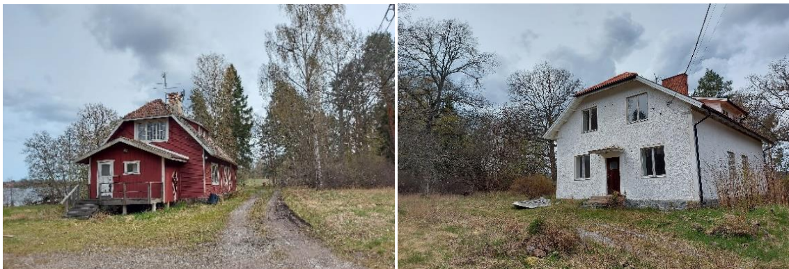
Figur 3. De två befintliga bostadshusen inom fastigheten Ilända 1:6.

Om den befintliga röda byggnaden bevaras kan ett undantag göras från minsta tillåtna fastighetstorlek och tillåtna antal bostäder. Vid ett bevarande av den kan ytterligare en bostad prövas uppföras inom den röda bostadens föreslagna fastighet, öster om befintlig byggnad, söder om vägen. I sådant fall bedöms dessa två fastigheter bli cirka 600m 2 under förutsättning att det går att reglera k-bonus som är beroende av två fastigheter. Alternativt kan k-bonus innebära att det röda huset står kvar och ytterligare ett möjliggörs på samma fastighet. För att detta villkor ska gälla måste den röda bostaden ges skydds- eller varsamhetsbestämmelser i detaljplanen så att den inte kraftigt förändras eller rivs. K-bonus är en planbestämmelse som innebär att byggnadsarean för en befintlig byggnad med skydds- eller varsamhetsbestämmelse räknas bort från den totala byggnadsarean om byggnaden vid en nybyggnation på fastigheten får stå kvar på sin ursprungliga plats och inte rivs. K-bonus gäller inte om byggnaden flyttas till en annan plats på tomten. Om byggnaden senare rivs, flyttas eller byggs till förlorar fastigheten den extra byggrätten. Möjlighet att införa sådan planbestämmelse, eller liknande, ska diskuteras med kommunens projektledare under planarbetet.