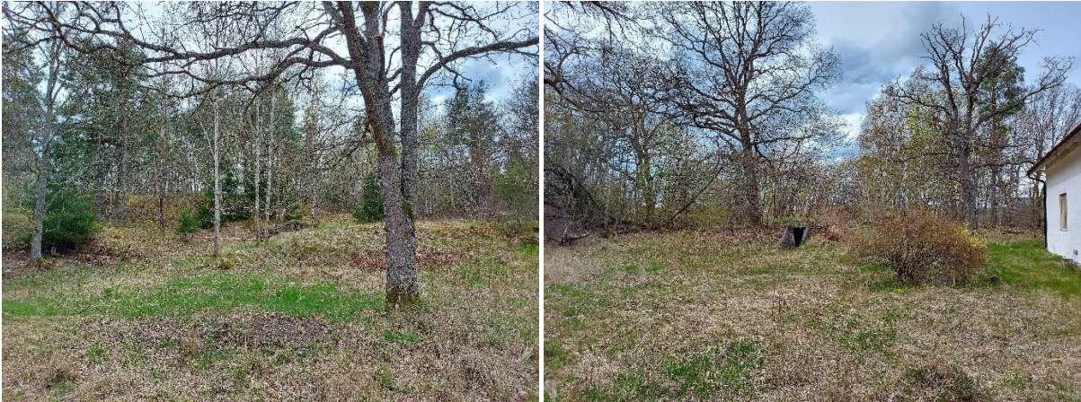
Figur 2. Delar av naturen inom planområdet invid de befintliga bostäderna.