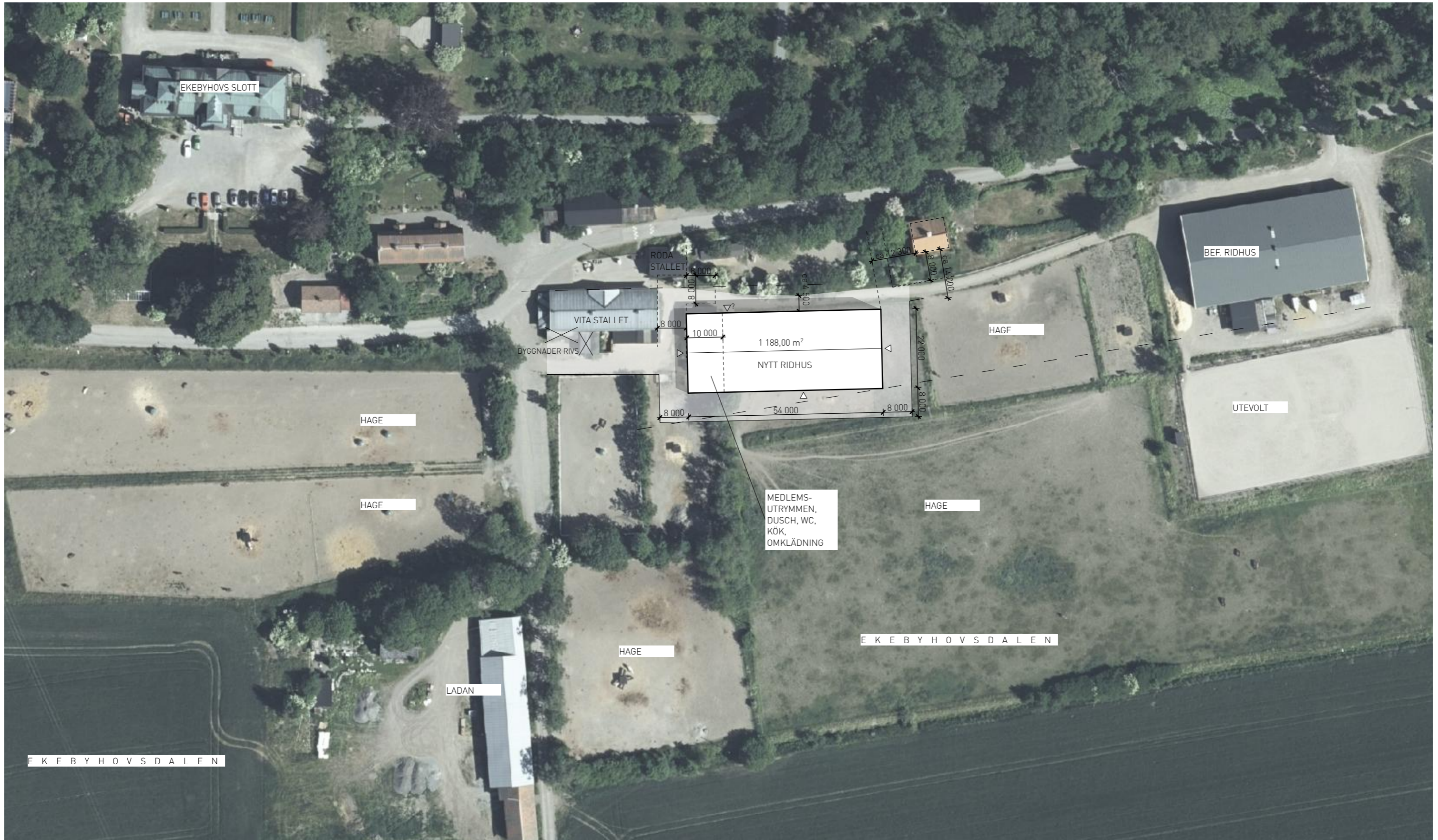
SITUATIONSPLAN @A3 1:1000