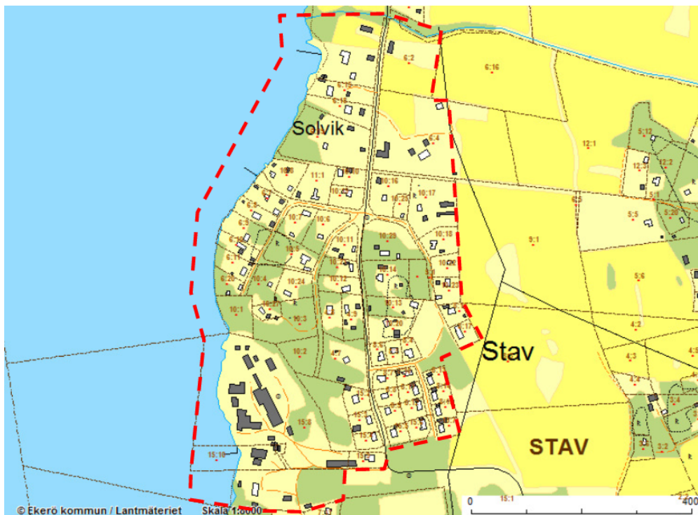
Figur 1 Planuppdraget från 2016 avser området inom rödstreckad linje.

I december år 2016, drygt två månader efter planuppdraget, beslutade Länsstyrelsen att förelägga kommunen att bestämma verksamhetsområde för allmänna dricks- och spillvattentjänster samt att tillgodose behovet av dessa vattentjänster för befintliga och planerade fastigheter i området Stav. Med verksamhetsområde menas det geografiska område inom vilket en eller flera vattentjänster har eller ska ordnas genom en allmän va-anläggning. Länsstyrelsen beslutade att verksamhetsområdet åtminstone skulle omfatta de fastigheter som då var anslutna till den allmänna dricksvatten- och spillvattenanläggningen som drevs av Stavsborgs samfällighetsförening. Beslutet fick laga kraft år 2017 och innebar att kommunen fick bilda verksamhetsområde för del av området och uppdra åt Ekerövatten att ordna kommunalt VA innan detaljplanarbetet påbörjats.