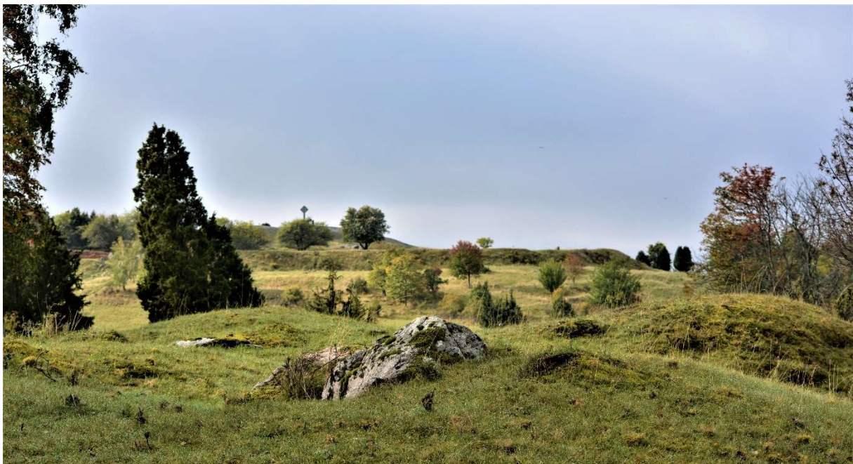
Fig 4. Hemlanden på Birka.

Världsarvsområdet utgörs av 226 hektar mark. Majoriteten av marken ägs av staten och förvaltas genom SFV, mindre delar ägs och förvaltas av Ekerö kommun, Adelsö-Munsö församling och ett antal privatpersoner. Världsarvsområdet omges av en buffertzonen som omfattar hela Björkö och de centrala delarna av Adelsö. Buffertzonen utgörs av riksintresseområdet för kulturmiljövården, Adelsö - Björkö – Birka (AB21), se figur 2. Gränserna för riksintresseområdet justerades efter beslut av RAÅ och Länsstyrelsen i juni 2023. Utifrån detta kommer gränserna för buffertzonen också att justeras och en ansökan om detta kommer att skickas till UNESCO under år 2024. Världsarvsrådet har varit med i diskussioner kring dessa ändringar och har inget att erinra emot dem.