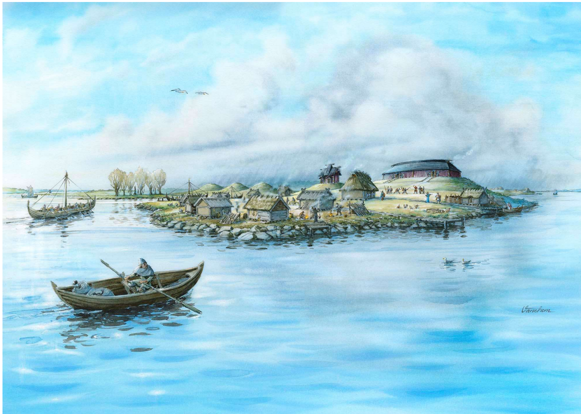
Fig 5. "Hovgården på 900-talet". Illustration av Mats Vänehem (2022). Publicerad med tillstånd av Ekerö kommun.

För fylligare information om fornlämningarna och de arkeologiska undersökningarna och forskningsresultat hänvisas till OUV, Birkaportalen 2 samt nyare forskning och arkeologiska rapporter.