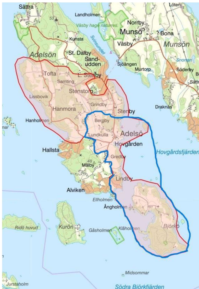
Fig. 2. Buffertzonen för världsarvet Birka och Hovgården utgörs av riksintresse för kulturmiljövården (AB 21), se blå avgränsningslinje. RAÄ beslutade år 2023 att ändra gränser för detta, den äldre avgränsningen är markerad med röd begränsningslinje (ref dnr RAÄ 2021-1675, 20230601).

Varje världsarv har också en buffertzona. Det är ett område som omger världsarvet och som genom sina särskilda restriktioner förstärker skyddet kring världsarvet. För Birka och Hovgården är detta område detsamma som riksintresseområdet Adelsö - Björkö-Birka [AB 21], vilket omger världsarvet.