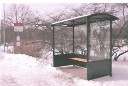
Folkets Hus Ölsta