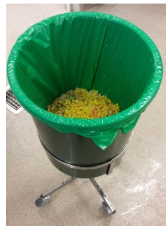
Bild vänster: Studiebesök Telge Återvinning, Tveta. Malning av matavfall inspekteras. 2013-10-22.