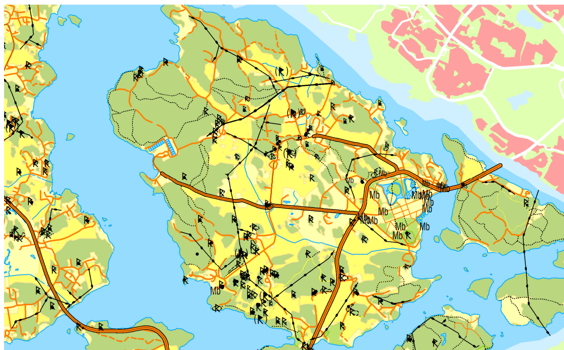
Kartöversikt över Lovön och dess fornlämningar.

Markåtgärder eller andra ingrepp som t ex uppsättande av stängsel får inte ske inom fornlämnings- eller skyddsområde utan samråd och särskilt tillstånd enligt KML från Länsstyrelsen. Om marken i anslutning till fornlämningar används till t.ex. hästhagar, ska observeras att hårt markslitage kan skada fornlämningarna och därmed strida mot KML. Ett väl planerat bete kan däremot vara positivt för att hålla markerna öppna.