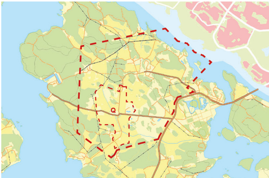
Kartöversikt, området är markerat med röd streckad linje