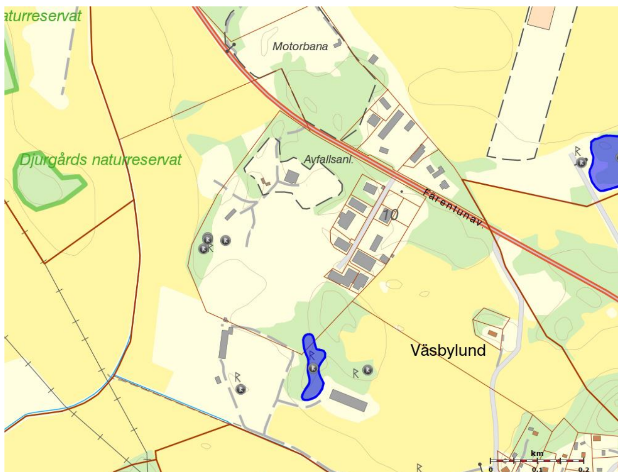
Utdrag ur Fornsök, Raä