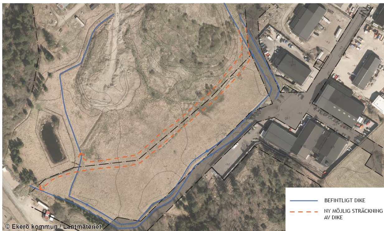
Schematisk illustration på omläggning av befintligt dike.

För avvattnings av deponin löper ett yttre och inre dike. Där diket löper föreslås att vägar anläggs för angöring till nya verksamhetstomter och befintlig ÅVC. Därmed behöver diket flyttas. Nedan finns en schematisk illustration på hur detta skulle vara möjligt. Detta behöver utredas vidare i planarbetet.