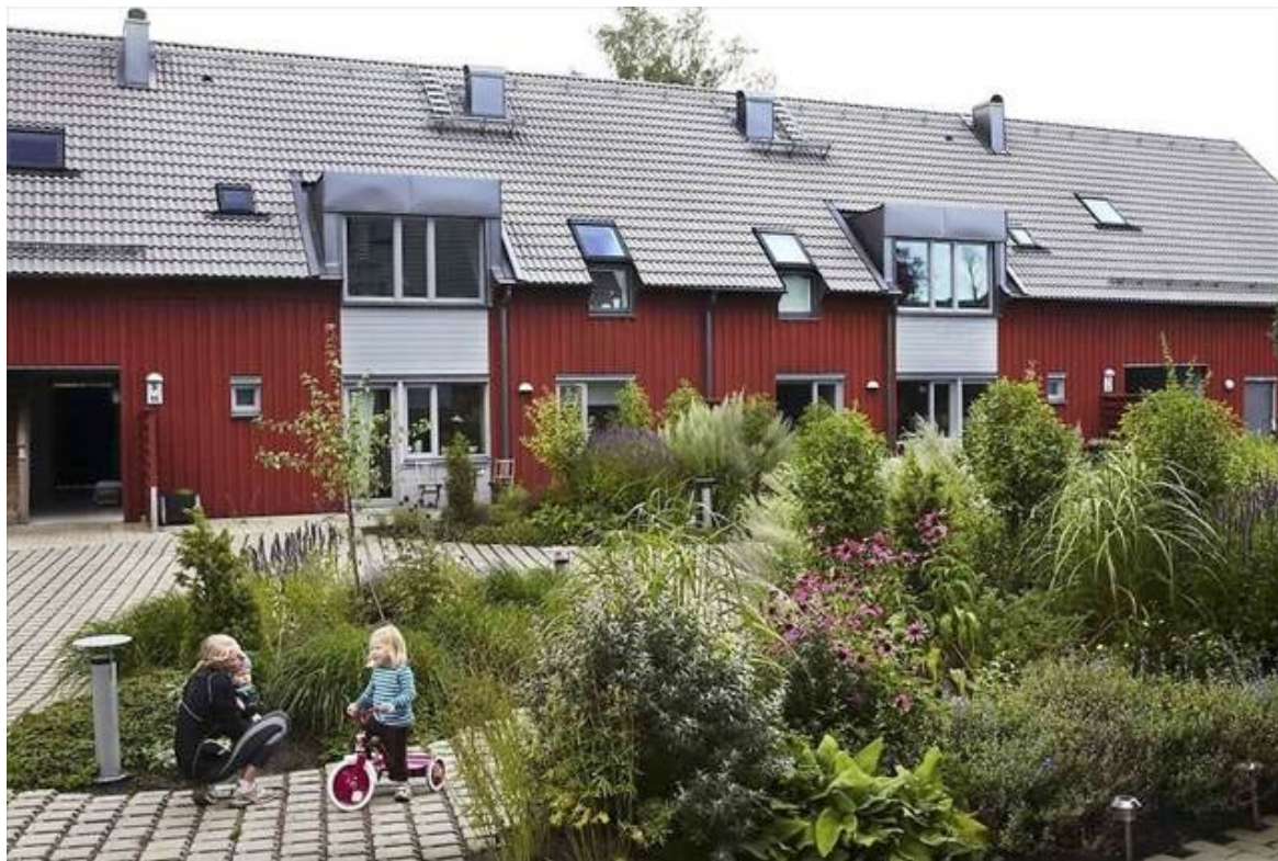
Inspirationsbild från Brf Öjersjö i Partille.

Ny sammanhållen rad- och kedjehusbebyggelse ska däremot uppföras med träfasader och med en kulör med minst 50% svärta, med hänsyn till landskapsbilden. Taktäckning ska vara av takpannor i svart eller tegelröd kulör alternativt svart eller tegelröd bandfalsad plåt.