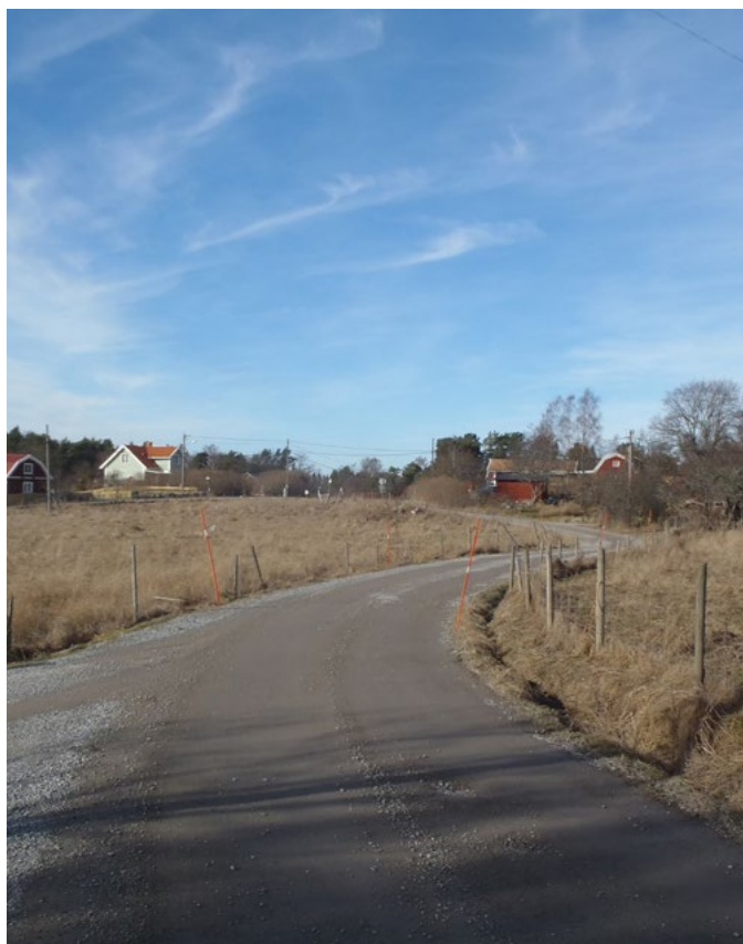
Söderbergavägen som slingrar sig fram

Söderberga består av ett varierat åker- och skogslandskap, en lantlig karaktär med smala och slingriga vägar, småskalig bebyggelse samt aktivt jordbruk och hästhållning i nära anslutning till bebyggelsen. Bebyggelsen har stora tomter och omges av mycket grönska. Vid ny bebyggelse är det av stor vikt att denna miljöns kvaliteter bevaras.