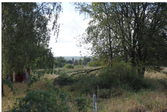
Ången med utblick söderut

Med hänsyn till områdets gröna karaktär föreslås en variation i storlek på avstyckningarna. På så sätt kan en god variation i området uppnås och mycket grönska bevaras. Genom att behålla en stor del av den gröna lungan som går mitt i Söderberga bevaras Söderbergas gamla struktur med mindre enheter av bebyggelse. Genom att bevara den gröna lungan skapas även utblickar ut mot det omgivande landskapet.