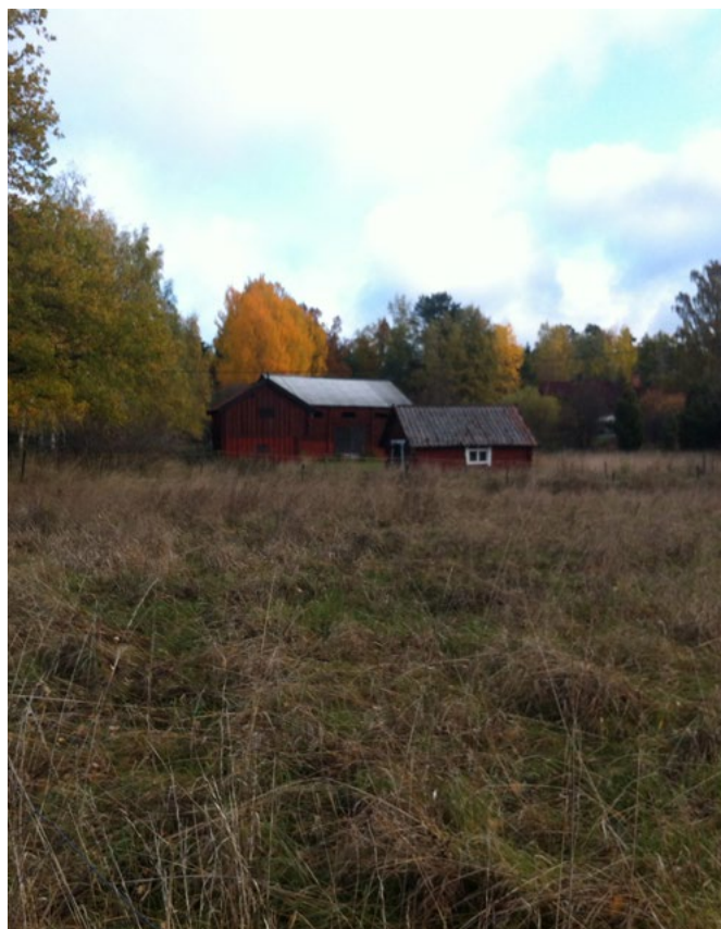
De röda husen centralt i Söderberga