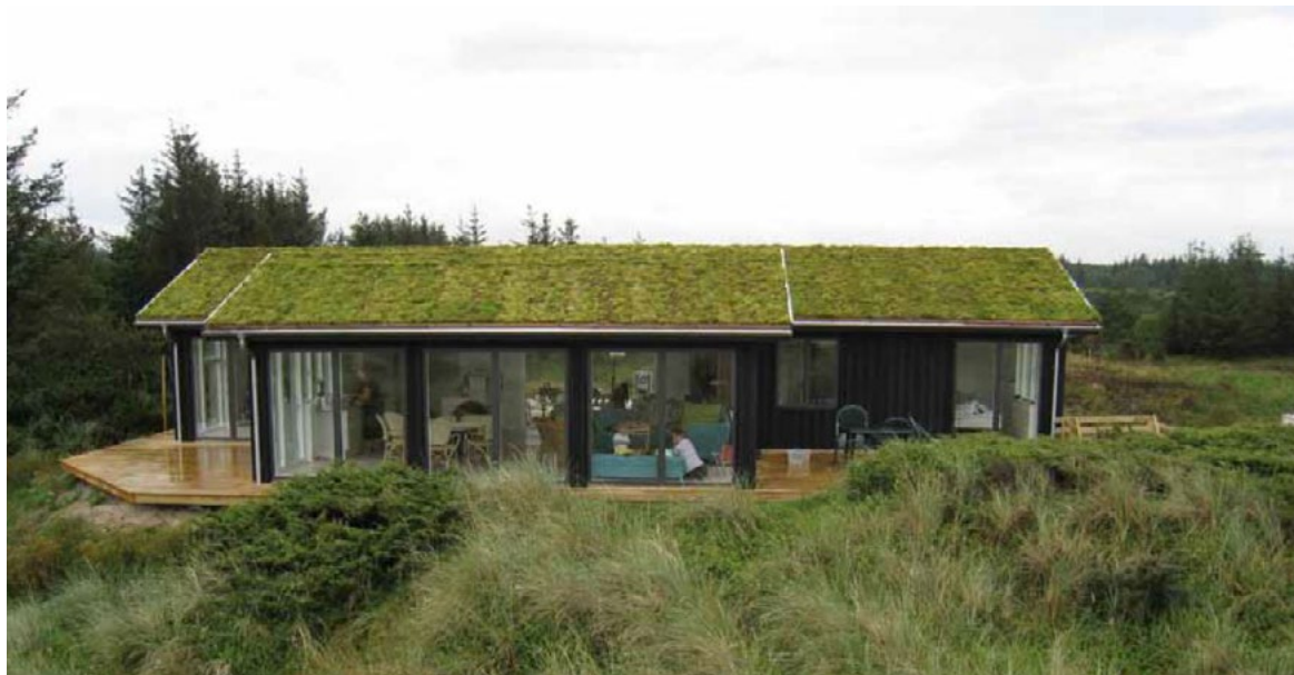
Inspirationsbild på hus med takvegetation som smälter in i landskapet.

Utformningen på Söderberga 1:14 + Skå-Eneby 3:7 blir även den särskilt viktig då den nya bebyggelsen ska anpassas till placeringen i landskapet och närheten till golfbanan. Radhusen eller kedjehusbebyggelsen ska uppföras med sadeltak som har takvegetation samt träfasad. Färgsättningen ska ske med mörkare kulörer med en minsta svärta på 50 %. Byggnaderna ska vara enfärgade med undantag för detaljer. Även här föreslås kortsidor placeras mot gata.