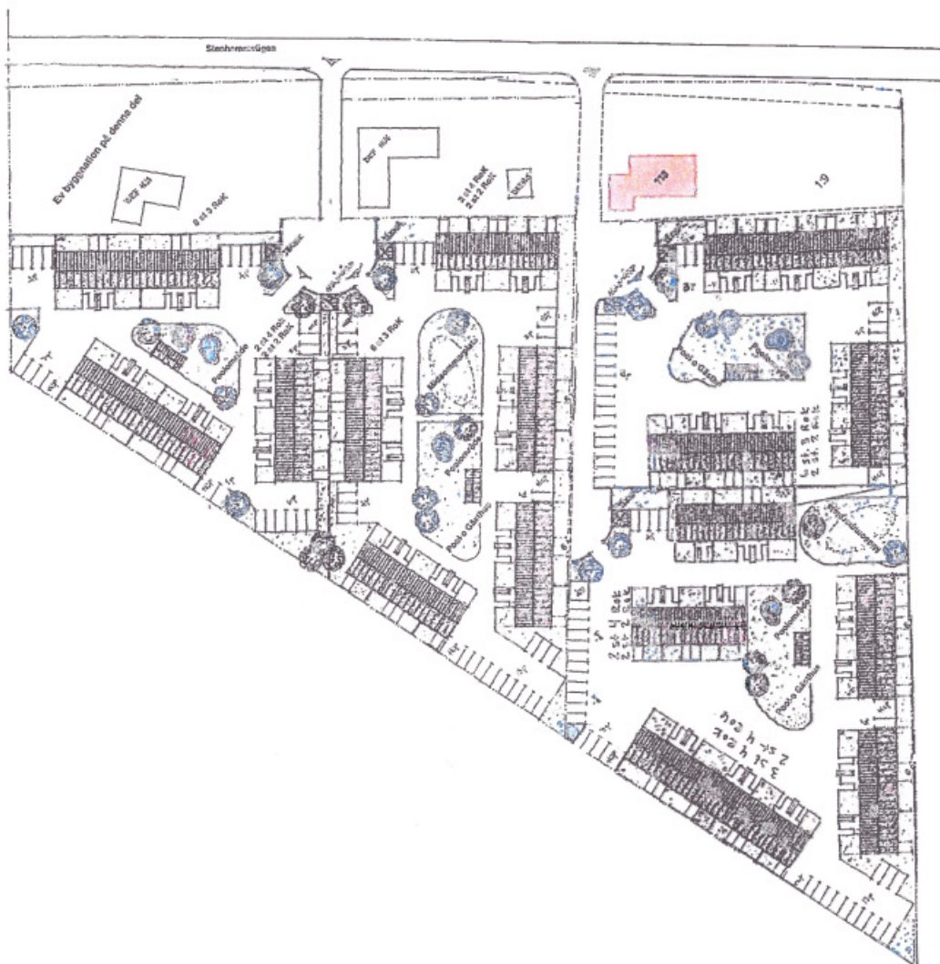
Illustrationsplan, bilaga till ansökan.