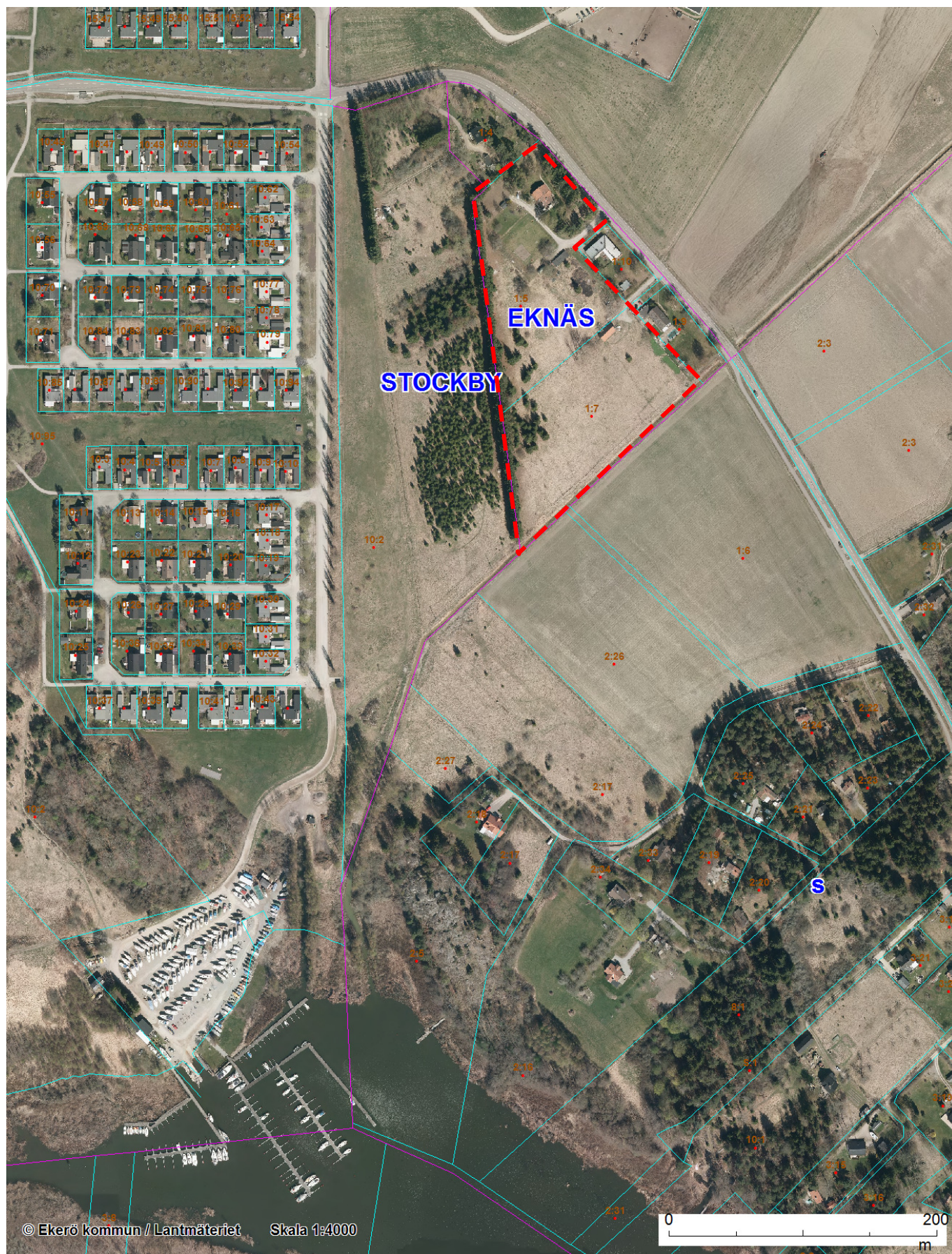
Ortofoto 2012 med utredningsområdet markerat.