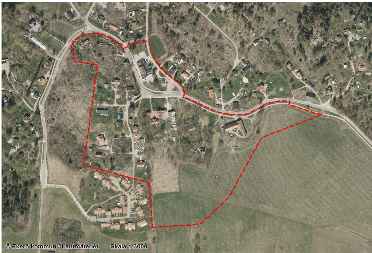
Ortofoto över Kungsberga. Planområdet rödmarkerat.