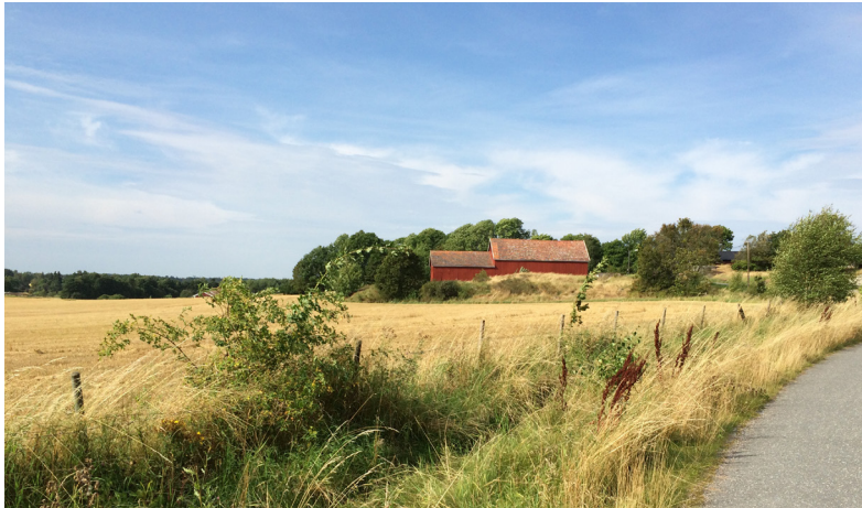
Ladan på Kungsberga 1:34.

Kungsberga består i huvudsak av de tolv gårdar som växte fram under medeltiden. Gårdarna byggdes upp på mindre brukbar jordbruksmark till förmån för jordbruket och fick sina namn enligt en numrering av respektive gård; ettan, tvåan osv.