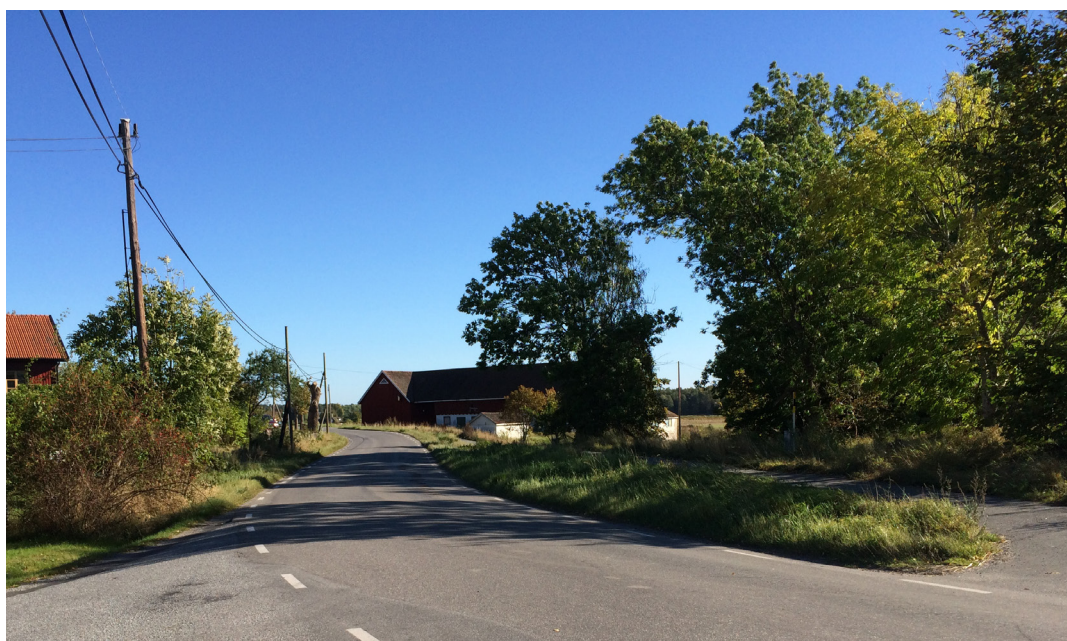
Kungsbergavägen, mot söder.

Med hänsyn till Kungsbergavägens historiska sträckning samt dess betydande del av byns lantliga karaktär, ska vägens dragning bevaras och dess utformning anpassas till omgivande bymiljö. Utformning av korsningspunkter med anslutande vägar ska ses över i det fortsatta