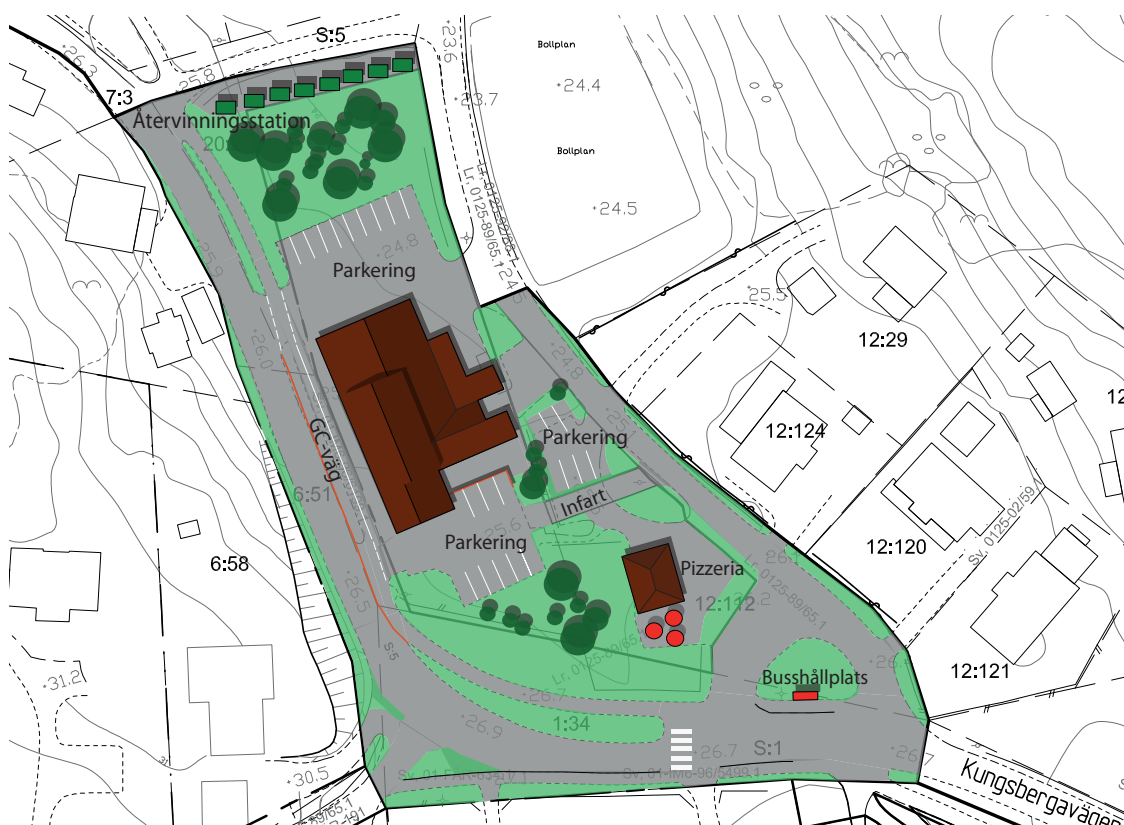
Förslag på utformning av trafiklösning kring Konsum i Kungsberga.

Infartsparkering föreslås, på grund av en mer strategisk placering, i anslutning till Färentuna skola och därmed inte inom denna detaljplan.