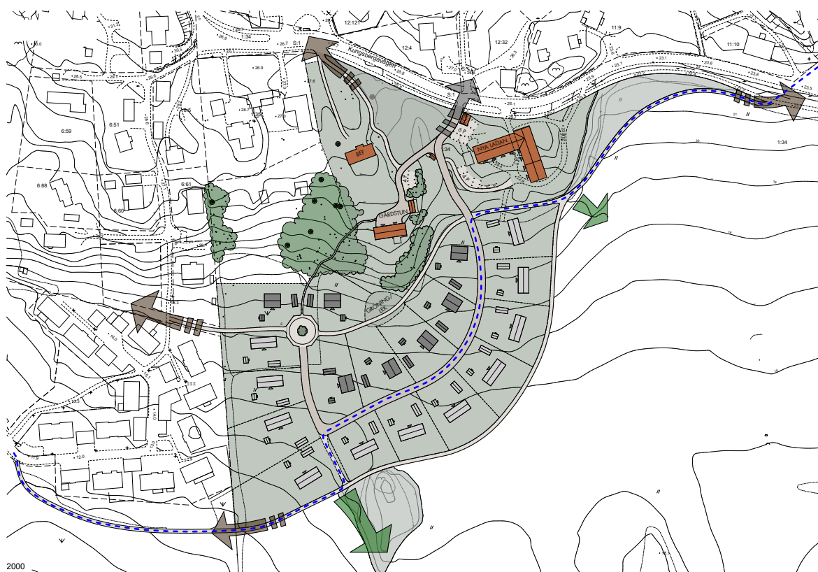
Illustrationsplan som visar föreslagen bebyggelse på Kungsberga 1:34.

De två byggnader på Kungsberga 1:34 som är i dåligt skick rivs och ersätts av nya bostäder i form av två parhus. Dessa ska placeras på samma plats som befintlig bebyggelse och till utformning och skala knyta an till befintlig gårdsbebyggelse. Den tredje bostadsbyggnaden som är i bättre skick ska bevaras. Varsamhetsbestämmelser införs för byggnaden.