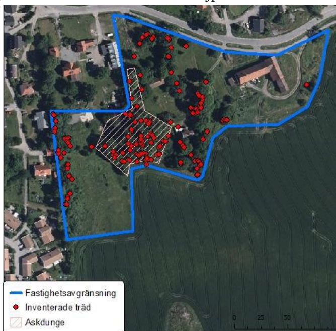
Askdungen på Kungsberga 1:34 med inventerade träd rödmarkerade och värdekärnan vitskafferad.

Den i rapporten utpekade värdekärnan som askdungen utgör ska undantas från exploatering. Området planläggs som allmän plats NATUR och omfattas och planbestämme om att marklov krävs för trädfällning av träd större än 10 cm i diameter. Trädfällning får endast ges om det behövs ur naturvårdssynpunkt, till exempel för att friställa andra mer