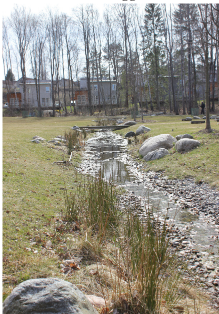
Dagvattenhantering i svackdike.

Ovan: Befintligt dike i planområdets södra del. Nedan: Principskiss för biofilter upplyft konstruktion.