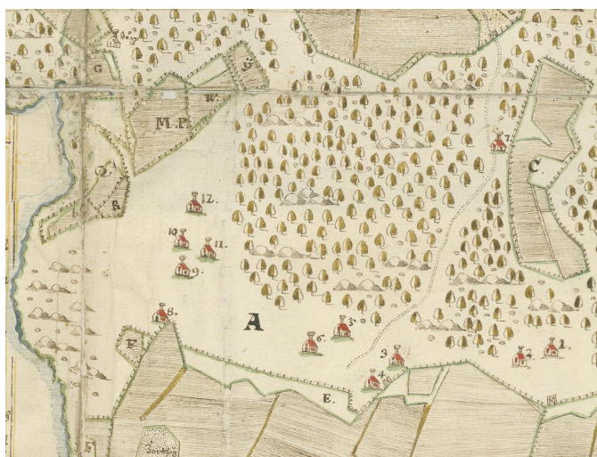
Karta över Kungsberga från 1630.

Kungsberga är en gammal bondby som ingår i Färentuna socken och har varit befolkad sedan tidig järnålder. Innan 1400-talet kallades byn för Berga och var ur medeltida mått en relativt stor by. Orten hade då tolv gårdar i jämförelse med många andra svenska byar som var hälften så stora. Från högmedeltiden finns tecken på kungliga ägor av byn då det finns dokumenterat att åtminstone två av gårdarna i Kungsberga tillhörde kronan och ägdes av biskop Bengt Birgersson i Linköping, bror till kung Magnus Ladulås.