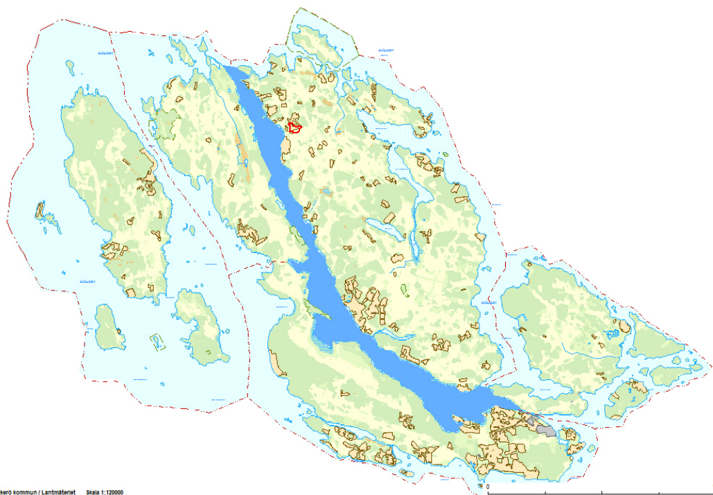
Långtarmens vattenförekomst (blåfärgad) och planområdet (rödmarkerat).

Då området till stor del består av jordbruksmark och infiltrationsmöjligheterna är begränsande till följd av att marken utgörs av lerjord, ska fördröjning och rening av dagvatten ske inom