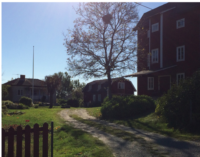
Kvarnbyggnad samt bostadshus på Kungsberga 6:5.

Bebyggelsen inom planområdet utgörs i huvudsak av fristående enbostadshus. Åldern på bebyggelsen varierar från nyare villor till egnahemsbebyggelse uppförd under början på 1900-talet samt äldre gårdsbebyggelse. Delar av bebyggelsen innehåller kulturmiljövärden på grund av dess karaktär samt historiska anknytning till platsen. Bland annat finns inom detaljplaneområdet 2/3 av de tolv ursprungliga gårdarna, samt en kvarnbyggnad och en ladugårdsbyggnad. I planområdets norra del ligger en matvarubutik som byggts under 1960-talet samt en byggnad som används för restaurangverksamhet. Två av de befintliga bostadshusen på Kungsberga 1:34 är i mycket dåligt skick och har främst ett värde genom att visa på en kontinuitet då platsen utgjort en gård redan under medeltiden.