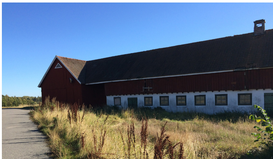
Ladugårdsbyggnad på Kungsberga 1:34.