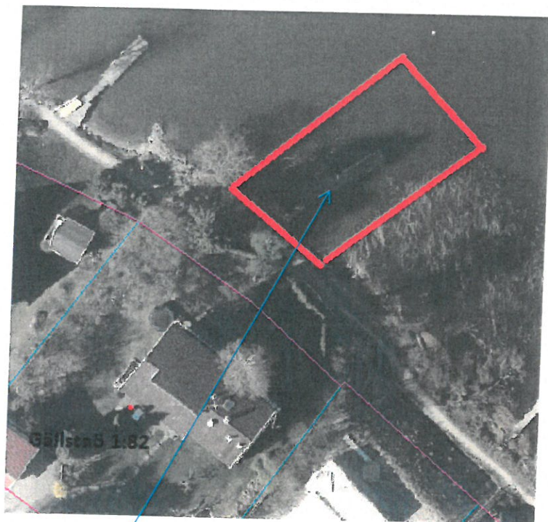
Befintlig brygga - arrendeområde