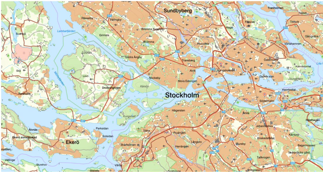
Illustration av vägnätet mellan fastigheten i rosa och kringliggande kommuner