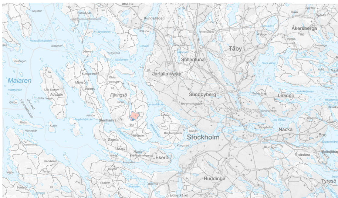
Fastighetens läge i Stor-Stockholm

Förfart Stockholm kommer att nås från Lovön. Trafikverket meddelar att förfarten tas i trafik 2030. Efter det kommer Nockebybron att kunna breddas till fyra filer med fortsatt öppningsbarhet.