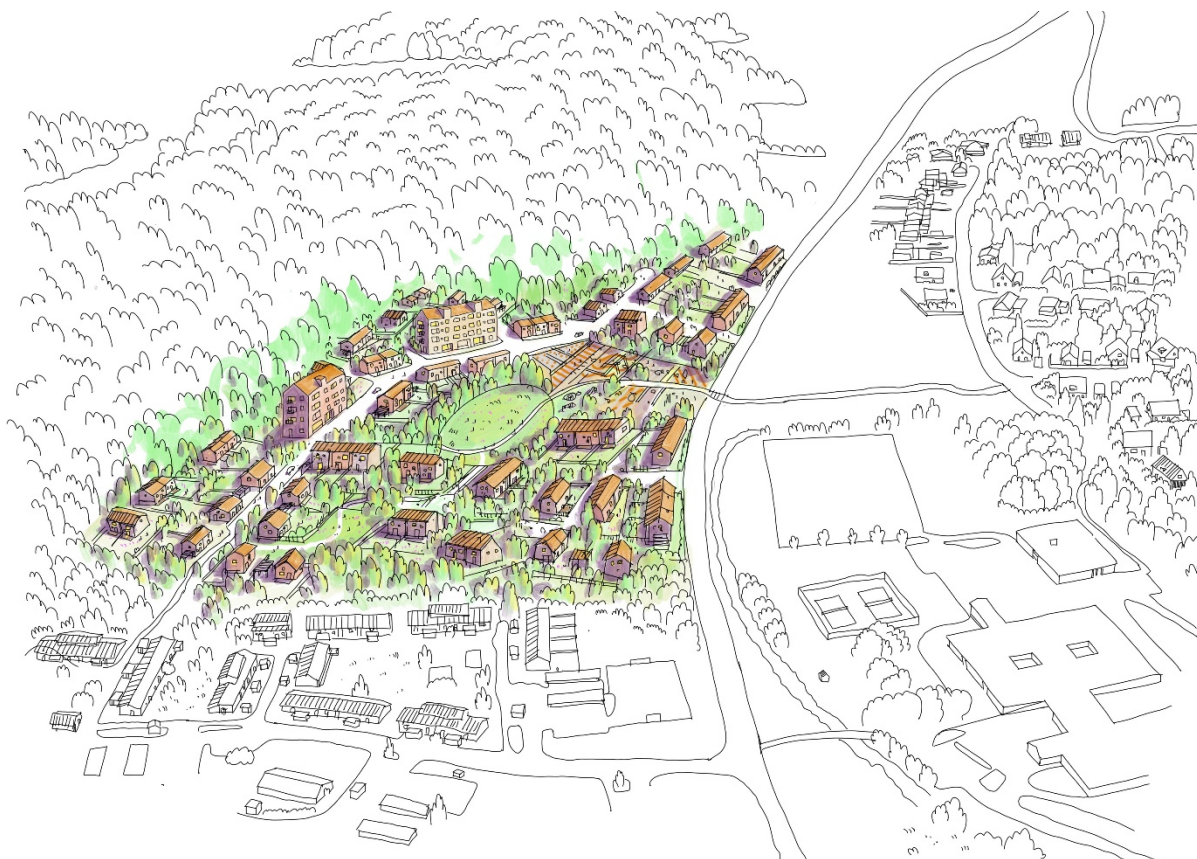
Figur 2 Tidig skiss som skickades in i samband med ansökan om planbesked (Bonava, 2019).