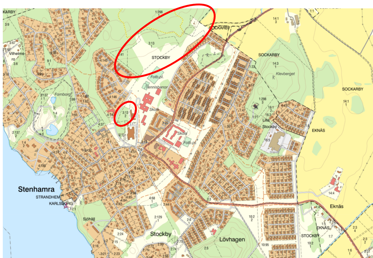
Figur 1: Karta som redovisar detaljplanens preliminära utredningsområde i rött.

I RUFS 2050 är området utpekade som en landsbygdsnod. En landsbygdsnod är en ort som har betydelse för den omgivande landsbygden och som bedöms ha potential att utvecklas som både nod och bostadsort. I RUFS 2050 finns det riktlinjer som Regionen bedömer är lämpliga att förhålla sig till när kommunen planerar sin utveckling.