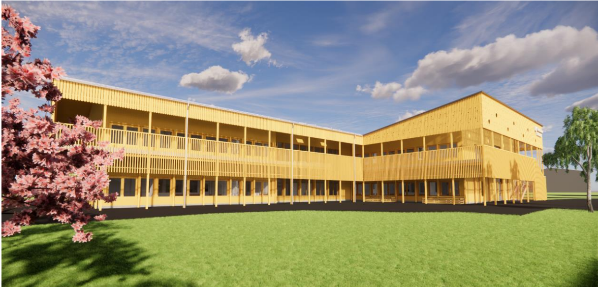
Illustration av den nya förskolan sett från gården.