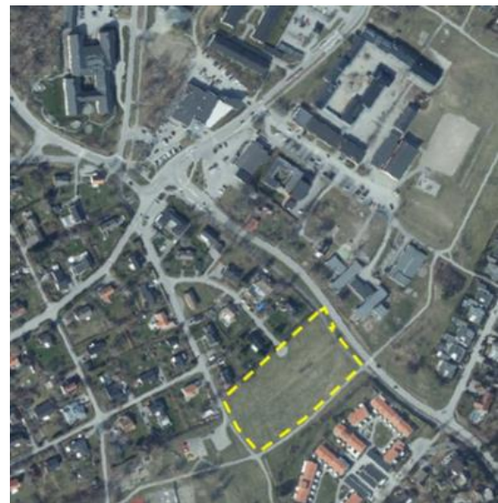
Ortofoto, förskolefastigheten gulmarkerad.