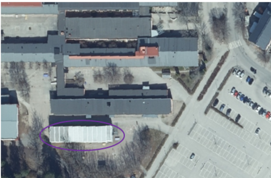
Paviljonguppställning Dnr BYGG.2016.470, bygglov tom 2024-06-16

Birkaskolan är en friskoleverksamhet som idag bedrivs delvis i Tappströmsskolan och delvis i en paviljonguppställning på Tappströms skolområde.