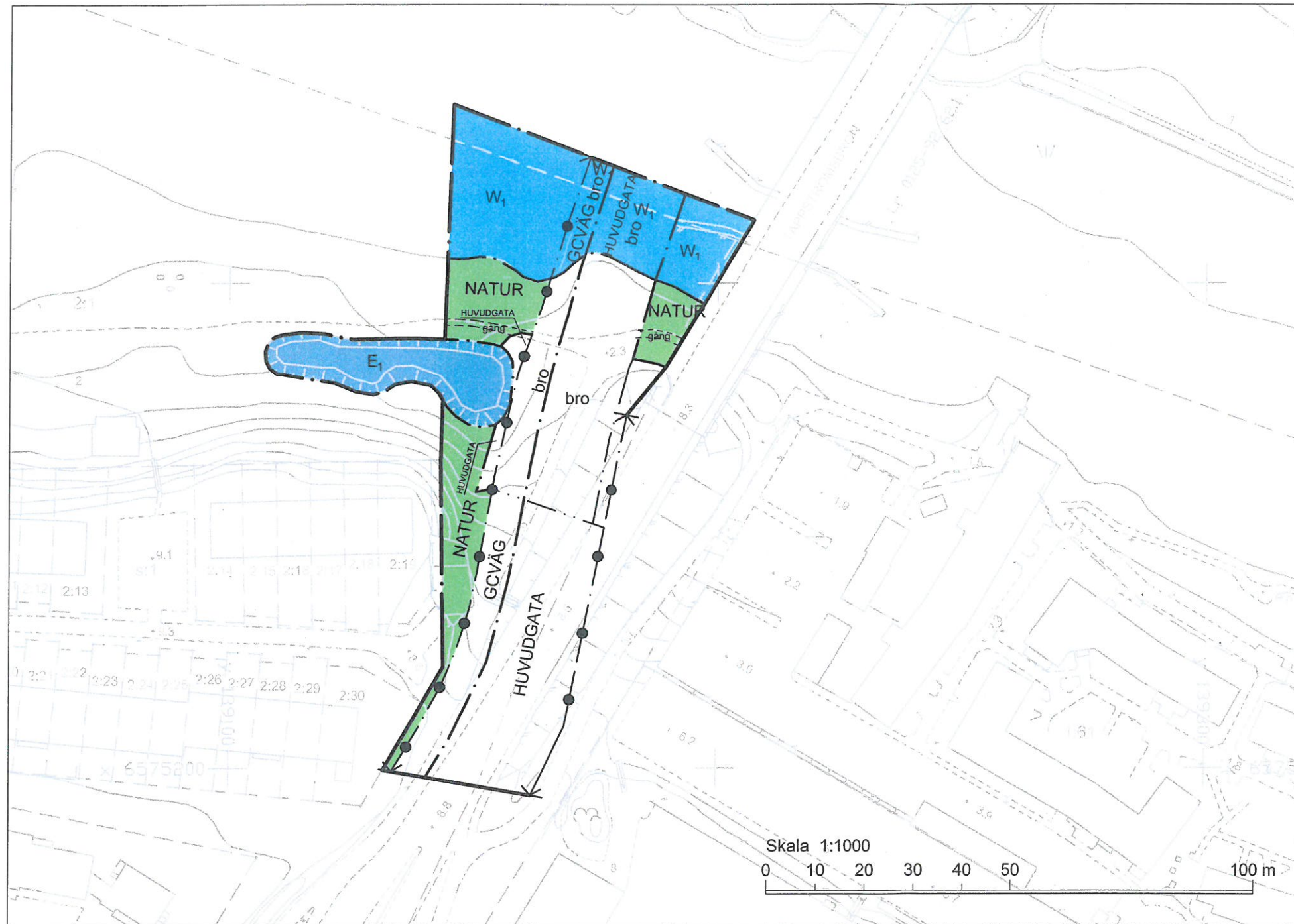
PLANKARTA SKALA 1:1000 (A3)