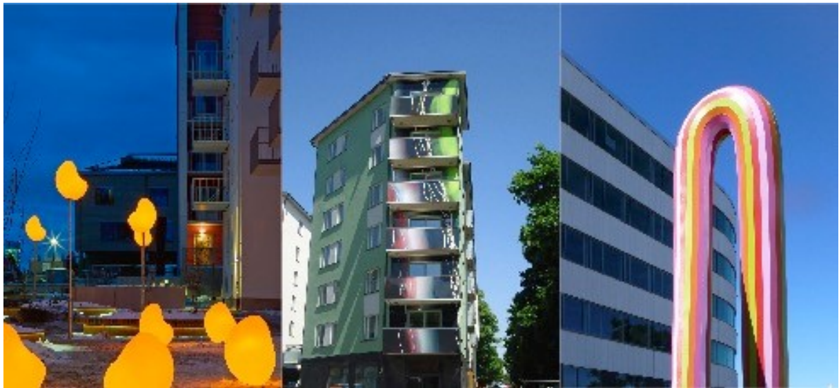
Exempel på konstprojekt i offentlig miljö genomförda av AM Public på uppdrag av Stora Ursvik, Familjebostäder och Vasakronan.

Konsten tillför flera dimensioner till övriga samhällsområden och kan fungera som drivkraft och stimulans i olika stadsutvecklingsprojekt. Utgångspunkten för konstprogrammet är att verka för att öka samspelet mellan plats och sammanhang och skapa mervärden i den stadsdelen. Det är av vikt att konstprogrammet förankras och utvecklas i dialog med beställaren och övriga berörda parter.