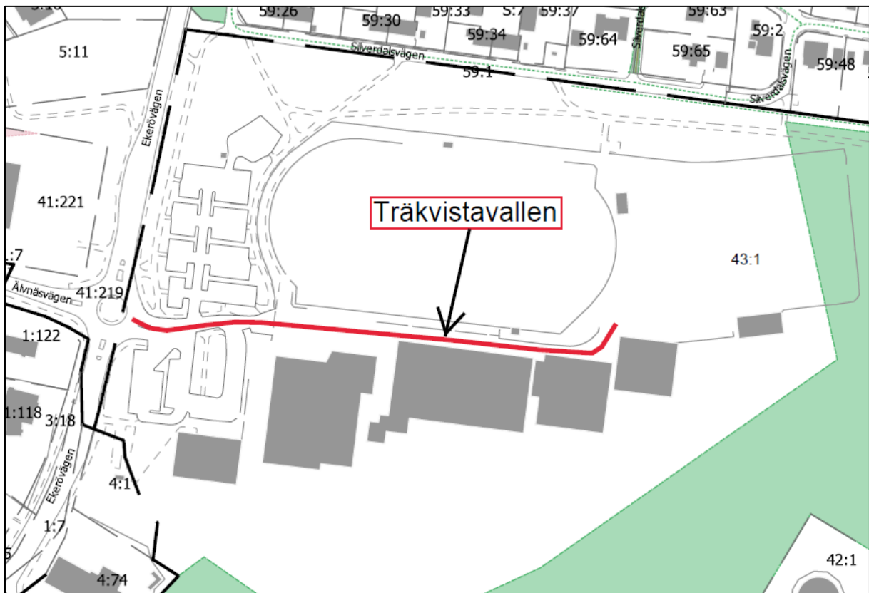
Karta över området med föreslaget adressområdesnamn

Namnet som föreslås på det nya adressområdet är "Träkvistavallen".