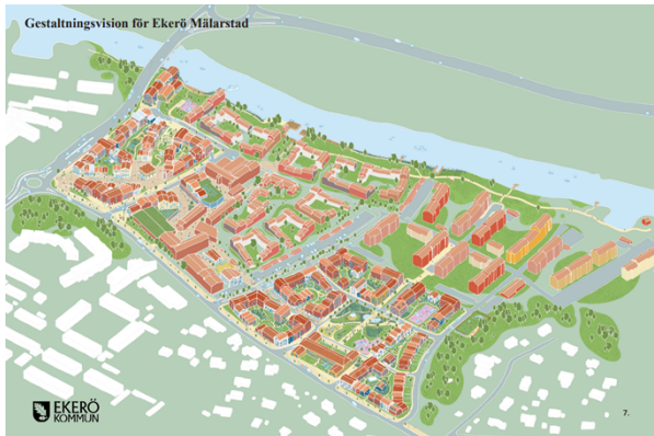
Axonometri ur gestaltningsvisionen