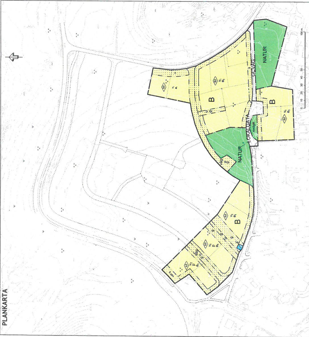
SKALA 1:1000 (A1), 1:2000 (A3)