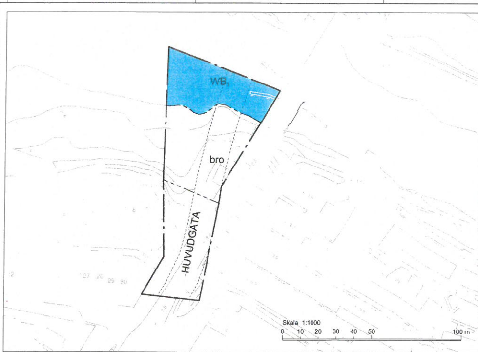
PLANKARTA SKALA 1:1000 (A3)