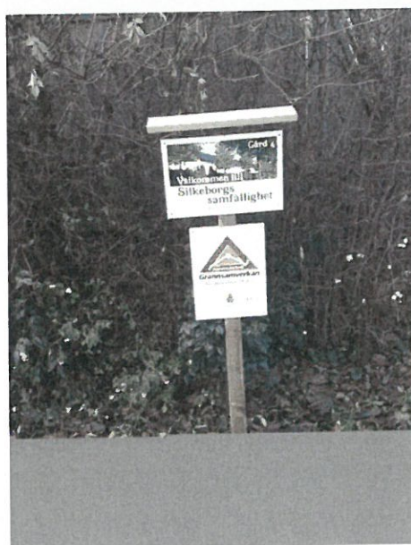
Ett bra exempel på att informera om att de boende har grannsamverkan.

www.samverkanmotbrott.se eller www.polisen.se