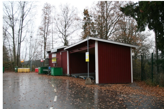
Bild 1: Breddning av infarten till Skå återvinningscentral, juni 2014.