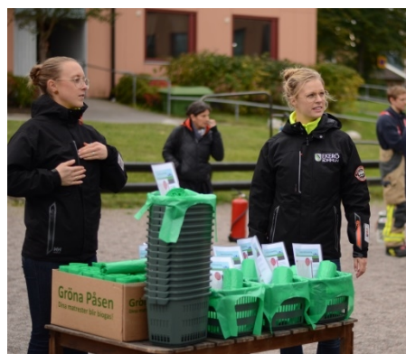
Bild 2: Utdelning av startpaket för matavfallsinsamling till ett flerbostadsområde, oktober 2014.