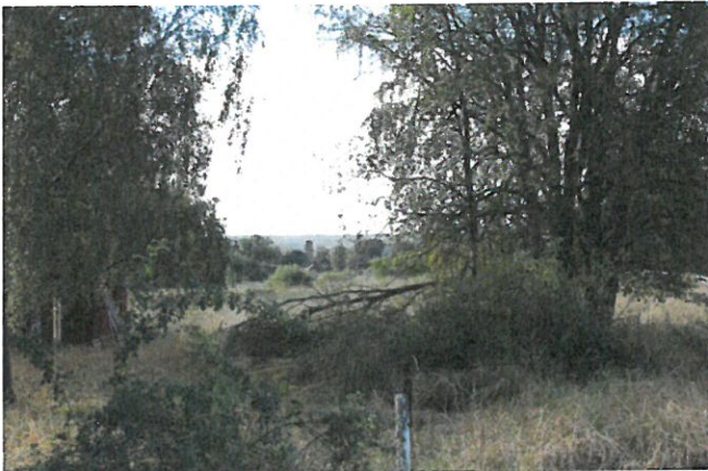
Ängen med utblick söderut

Med hänsyn till områdets gröna karaktär föreslås en variation i storlek på avstyckningarna. På så sätt kan en god variation i området uppnås och mycket grönska bevaras. Genom att behålla en stor del av den gröna lunda som går mitt i Söderberga bevaras Söderbergas gamla struktur med mindre enheter av bebyggelse. Genom att bevara den gröna länken skapas även utblickar ut mot det omgivande landskapet.