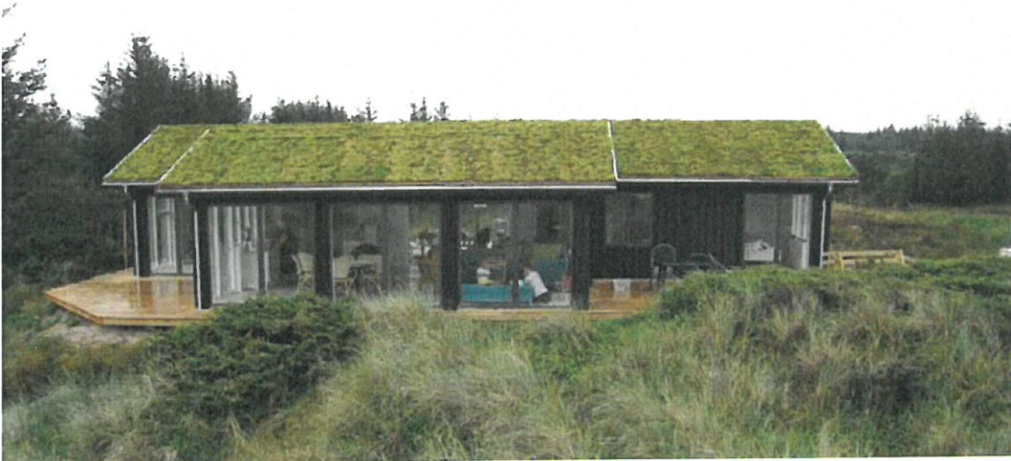
Inspirationsbild på hus med takvegetation som smälter in i landskapet.