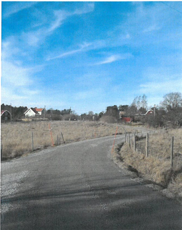
Söderbergavägen som slingrar sig fram

Söderberga består av ett varierat åker- och skogslandskap, en lantlig karaktär med smala och slingriga vägar, småskalig bebyggelse samt aktivt jordbruk och hästhållning i nära anslutning till bebyggelsen. Bebyggelsen har stora tomter och omges av mycket grönska. Vid ny bebyggelse är det av stor vikt att denna miljöns kvaliteter bevaras.