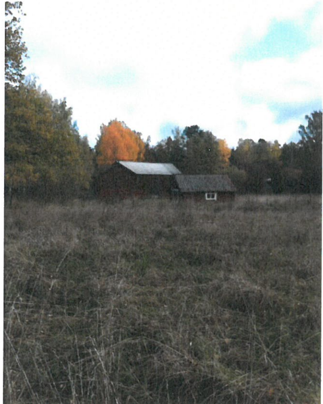
De röda husen centralt i Söderberga