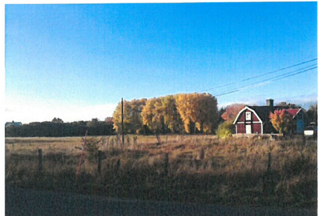
Trädsamling som bevaras

Centralt i Söderberga finns en grönyta med tre röda gamla hus som utgör ett värde för både natur- och kulturmiljön. Ängsmarken föreslås fortsatt vara en öppen yta så att ytan går att nyttjas till exempelvis midsommarfirande, som grillplats, för spontana aktiviteter såsom att ställa upp fotbollsmål, naturlekplats etc.