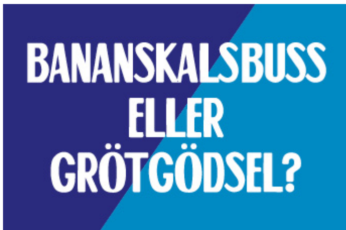
Bild: Axplock från kampanj: Sortera matresten ( www.sorteramatresten.se )

Stockholms läns kommuner började en gemensam informationskampanj, Sortera matresten, för att engagera alla som bor i regionen att sortera ut sina matrester. Kampanjen pågår under fem år. Ekerö kommun sitter med i styrgruppen genom en av avfallsingenjörerna.